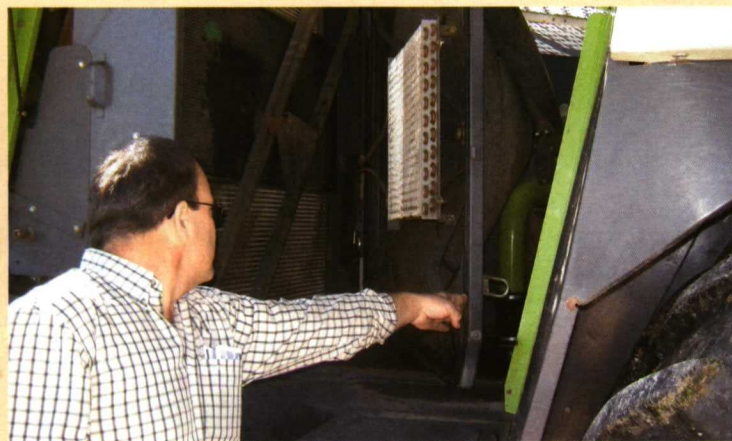
Plataforma de mantenimiento accesible.

Sevillana de Servicios, como empresa de servicios agrícolas, busca sacar el máximo rendimiento a sus equipos. Las picadoras de forraje son máquinas que realizan trabajo de forma estacional, ya que sus horas anuales se concentran en la campaña de recolección. Este periodo útil para el picado del forraje puede verse reducido por las condiciones climáticas. Por ello resulta especialmente necesario minimizar las incidencias que puedan ocurrir y las tareas no productivas. En la elección de su parque de máquinas en Sevillana de Servicios han tenido muy en cuenta estos aspectos, eligiendo máquinas de gran capacidad de trabajo con mantenimiento sencillo y de fácil acoplamiento de los distintos cabezales. ■