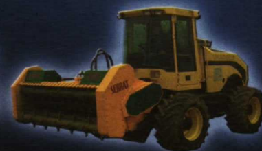
UNAC 300 NF

Río Cinca, 12 - 22510 Binaced (Huesca) Tel: 974 42 62 00 / Fax: 974 42 70 64