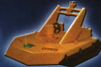
FORESTAL CADENAS CERRADA