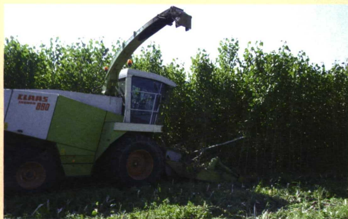
Picadora Jaguar 880 en una plantación de chopos para biomasa.

Para el picado de forraje con destino a alimentación animal o de cultivos herbáceos o leñosos para la producción de biomasa