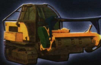
UNAC 160 C