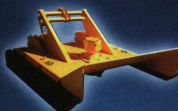
FORESTAL CADENAS ABIERTA