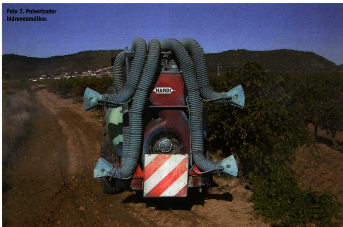
Foto 7. Pulverizador hidroneumático.