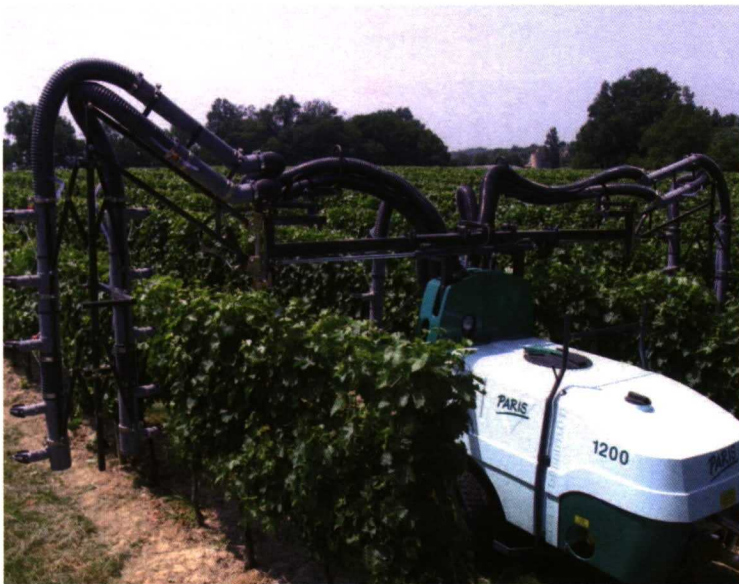
Foto 8. Pulverizador neumático adaptado a plantaciones en espaldera.

través de la corriente de aire generada por un ventilador y los pulverizadores neumáticos ( foto 8 ) en los que las gotas se forman al encontrarse la vena líquida con una corriente de aire que a su vez las transporta a la planta.