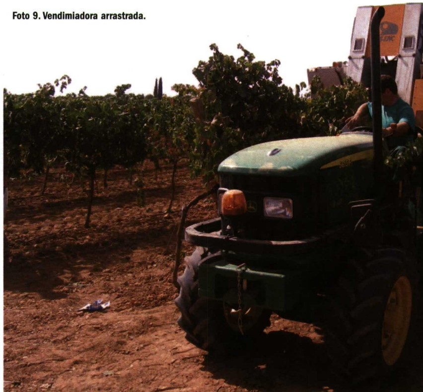
Foto 9. Vendimiadora arrastrada.

Son aquellas que se realizan durante el ciclo vegetativo de la vid, entre las que destacan: el despuntado, esperugado, deshojado, aclareo de racimos y la-