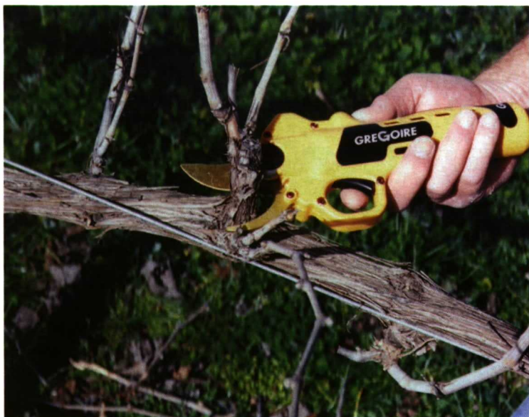
Foto 5. Tijeras de poda.