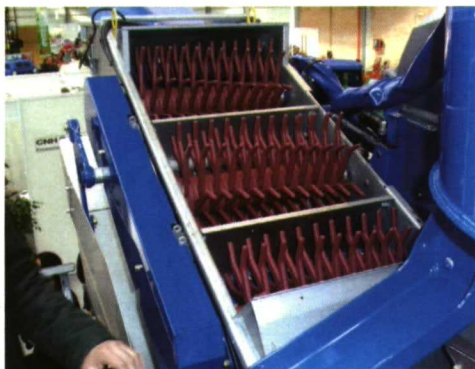
Foto 12. Despalillador-separador situado antes de la tolva de la vendimiadora.

sacudidores que mediante vibración producen el desprendimiento de la uva, la cual es depositada en una cadena de recogedores que la elevan hasta las tolvas. La máquina dispone de extractores de aire que limpian el producto antes de que llegue a la tolva.