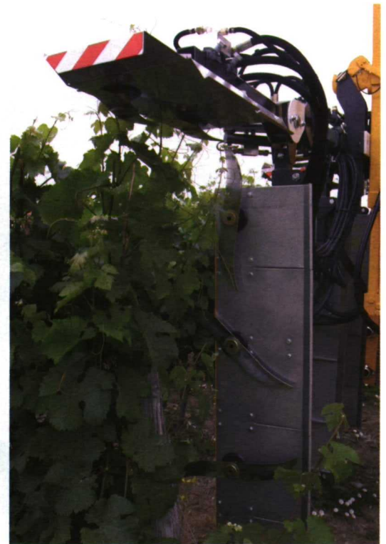
Foto 4. Despuntadora-prepodadora con cuchillas rotativas dispuestas en "L" invertida.