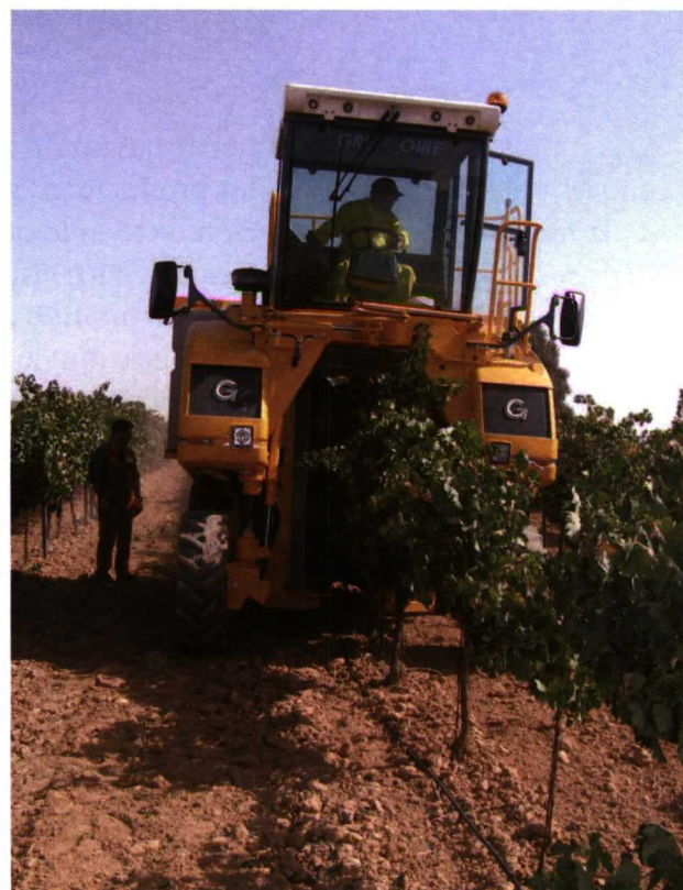
Fotos 10 y 11. Vendimiadora autopropulsada