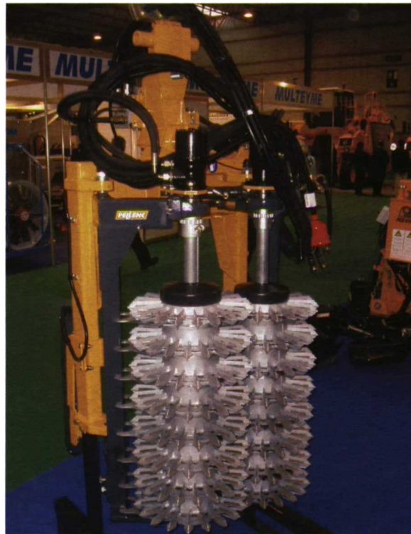
Foto 3. Módulo de corte rotativo de cuchilla-contracuchilla para prepodadora.

En cuanto a los sistemas de corte con movimiento alternativo se basan en barras de corte con cuchilla y contracuchilla o barras con doble cuchilla con movimiento alternativo. La barra de corte se ubica en un brazo cuya posición es regulable mediante sistemas oleohidráulicos, pudiendo así adoptar diferentes posiciones relativas con relación a la planta. La velocidad de trabajo de estos equipos se sitúa entre 3 y 4,5 km/h.