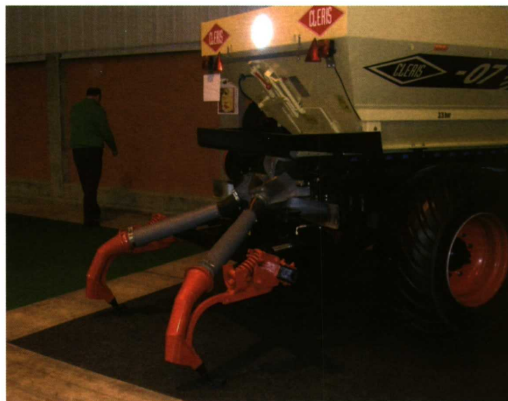
Foto 6. Abonadora con doble reja para localizar el abono.