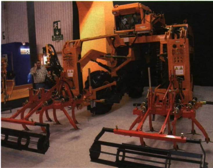
Foto 1. Cosechadora autopropulsada equipada con cultivador.