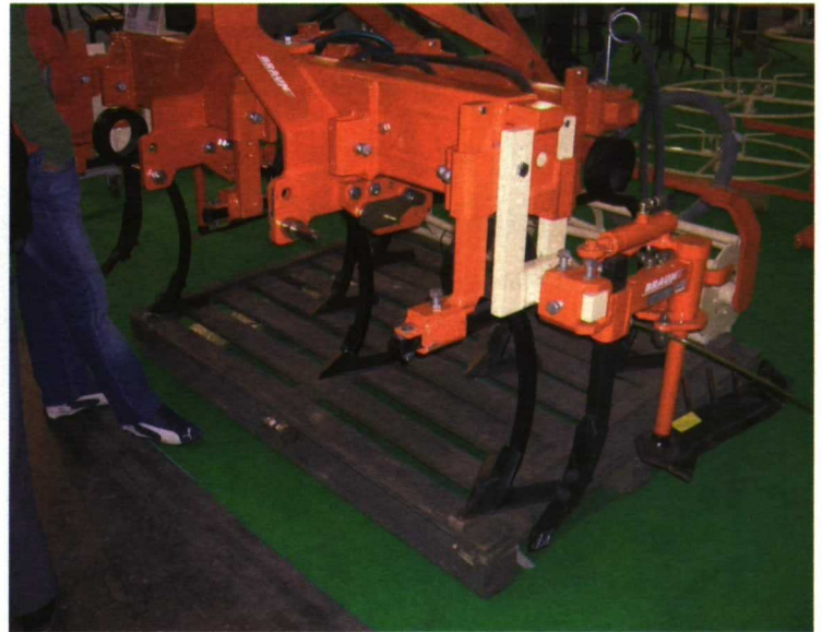
Foto 2. Cultivador equipado con reja intercepas.

formado por una barra con discos móviles que puede posicionarse para ajustar el corte en función de la geometría de la vegetación (foto 4). Para el caso de plantaciones en vaso, existen máquinas que disponen tornillos sinfines dispuestos a ambos lados de los discos rotativos que permiten levantar los sarmientos para facilitar su corte.