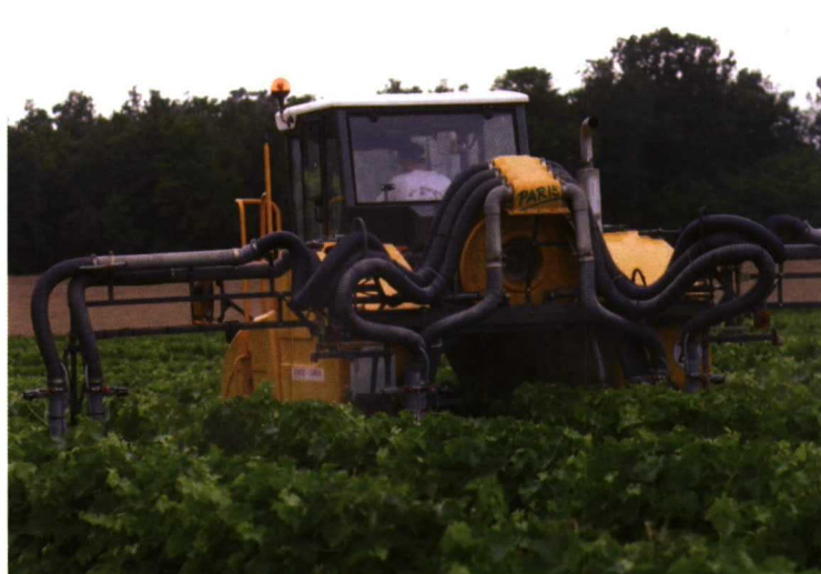
Foto 13. Vendimiadora equipada con pulverizador neumático.

Una de las principales características de este tipo de máquinas es su polivalencia ya que se pueden utilizar para otras labores distintas de la vendimia como son la poda, el laboreo (foto 1) y la aplicación de trata-