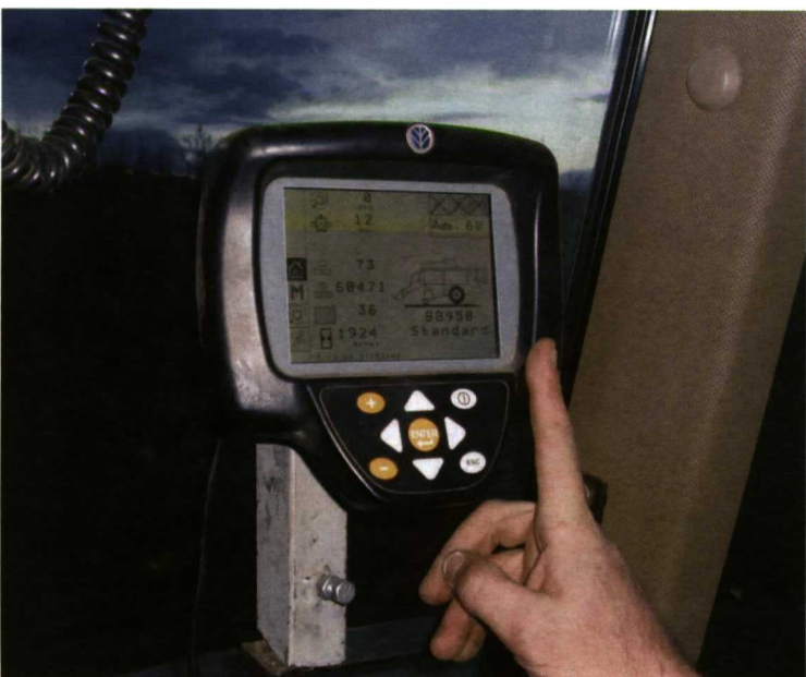
Foto 5. Consola de información y control situada en la cabina del tractor.