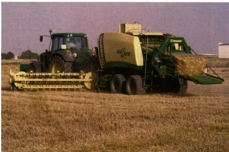
Foto 7. Macroempacadora multipaca BigPack de Krone.