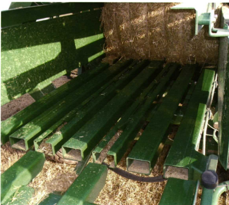
Foto 4. Canal de compresión.