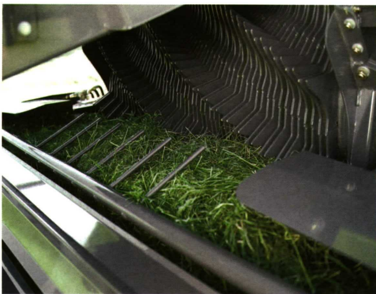
Foto 3. Dispositivo de picado de una macroempacadora. Documentación Claas.