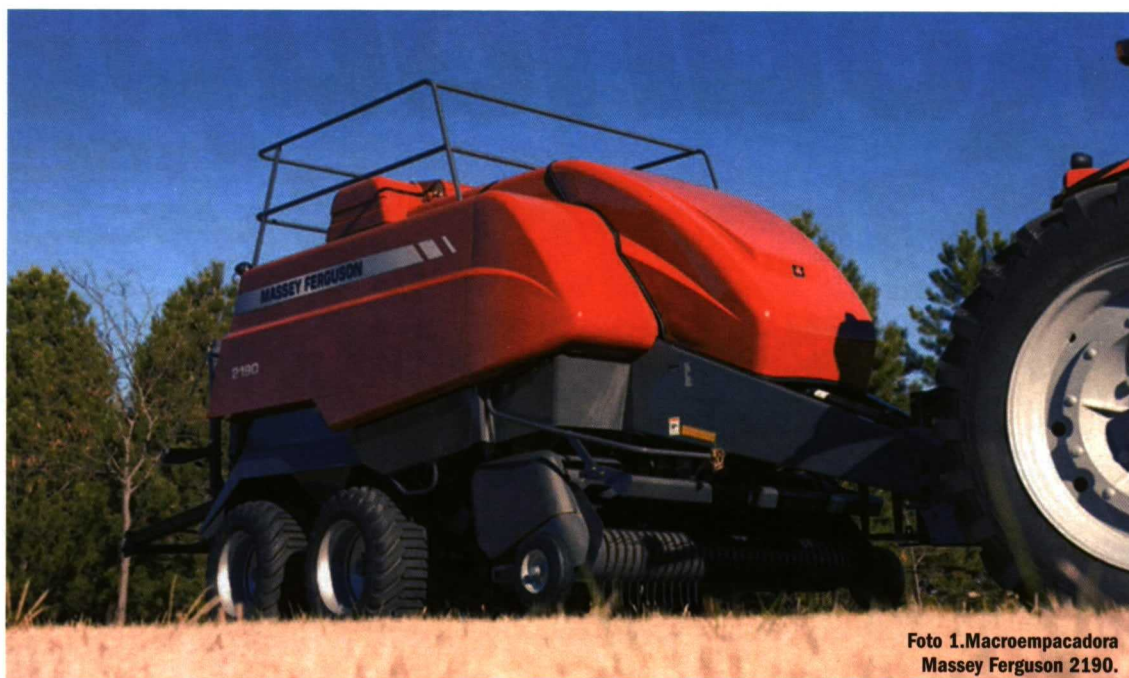
Foto 1. Macroempacadora Massey Ferguson 2190.

Análisis del funcionamiento básico y aspectos más novedosos de estas máquinas que copan la mitad de su mercado