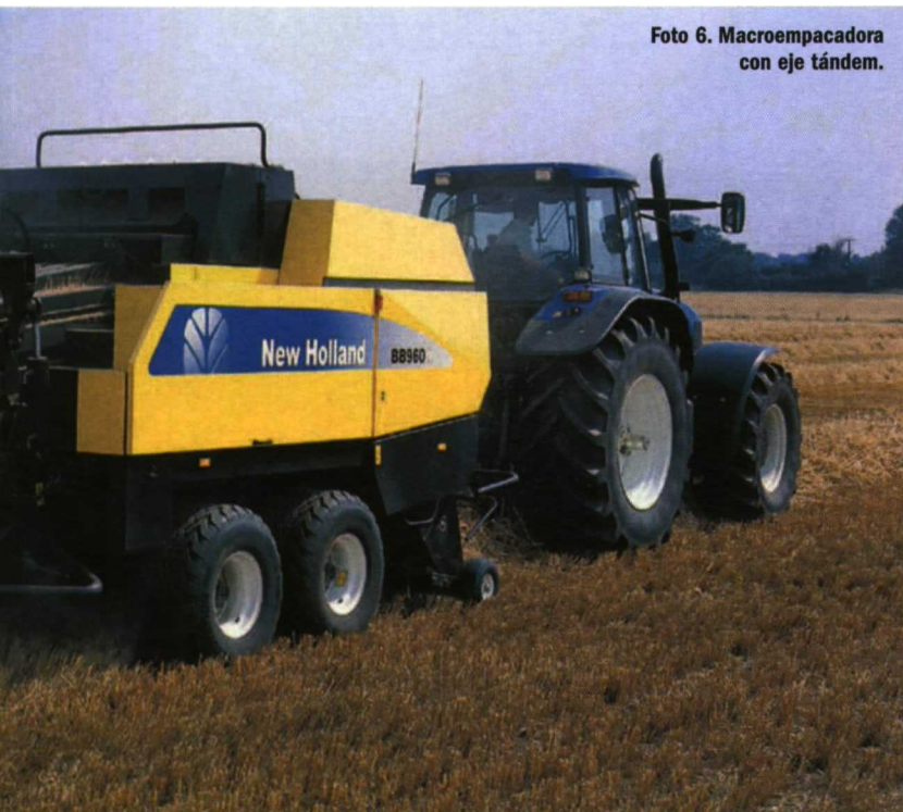
Foto 6. Macroempacadora con eje tándem.

dispositivos de picado ( foto 3 ) permite obtener longitudes de picado mínimas de aproximadamente 40 mm, pudiendo llegar hasta 20 mm en algunos modelos que disponen de un sistema de corte previo. Longitudes de picado pequeñas permiten aumentar el flujo de producto.