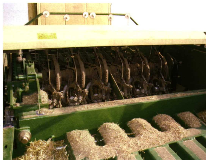
Foto 8. Dispositivo de atado con seis anudadores.

nas el sistema Isobus para establecer la comunicación digital o conexión entre dichas pantallas y la empacadora. La norma ISO 11873 regula el medio de transmisión, el enchufe de conexión y el intercambio de datos. El medio de transmisión de datos es un databus (can bus) de modo que la empacadora lleva un bus que se conecta directamente al bus del tractor no requiriendo cables de alimentación separados. Esta tecnología permite la utilización de un único terminal en la cabina del tractor para controlar diferentes aperos o implementos.