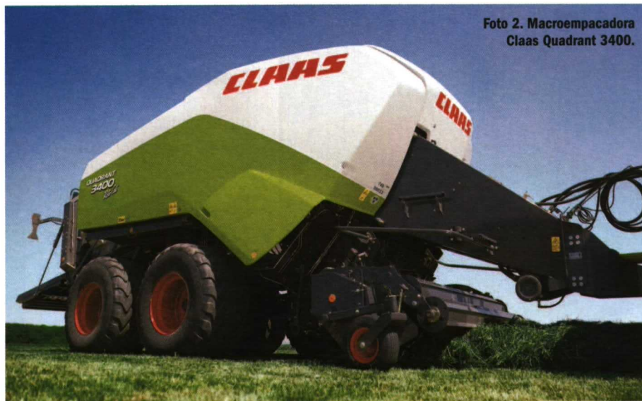
Foto 2. Macroempacadora Claas Quadrant 3400.

El sistema de trabajo ( figura 1 ) es muy similar al de las em-