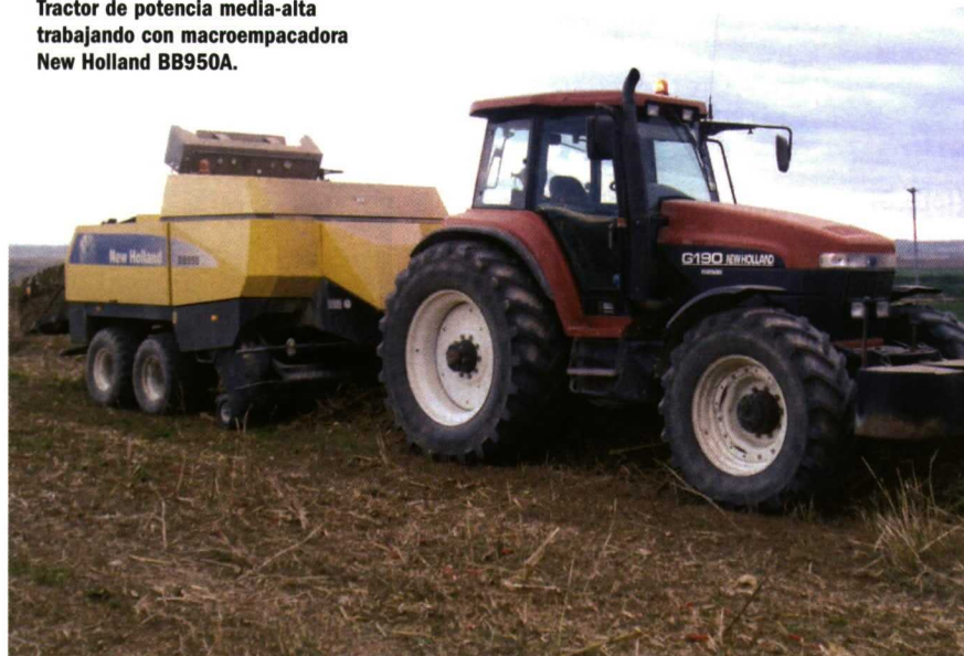
Tractor de potencia media-alta trabajando con macroempacadora New Holland BB950A.

siempre y cuando el mantenimiento de la máquina sea el adecuado. Para ello los sistemas de lubricación automáticos son muy útiles pero no eximen a la máquina de la necesaria revisión anual cuyo coste debe ser considerado al planificar la compra de la máquina.