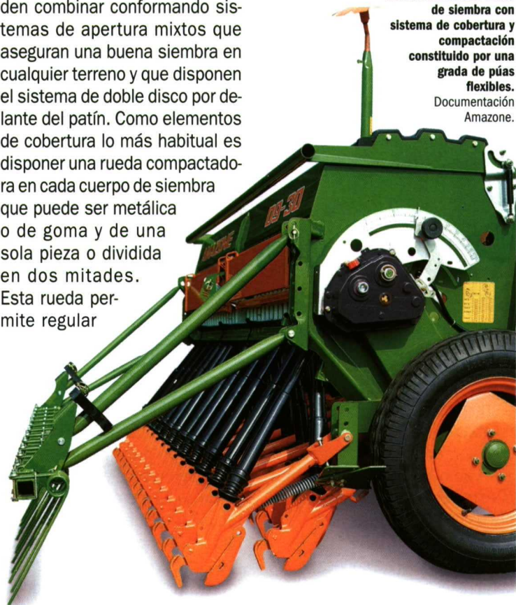
Foto 4. Sembradora convencional con botas de siembra con sistema de cobertura y compactación constituido por una grada de púas flexibles.

de W. Ambos sistemas se pueden combinar conformando sistemas de apertura mixtos que aseguran una buena siembra en cualquier terreno y que disponen el sistema de doble disco por delante del patín. Como elementos de cobertura lo más habitual es disponer una rueda compactadora en cada cuerpo de siembra que puede ser metálica o de goma y de una sola pieza o dividida en dos mitades. Esta rueda permite regular