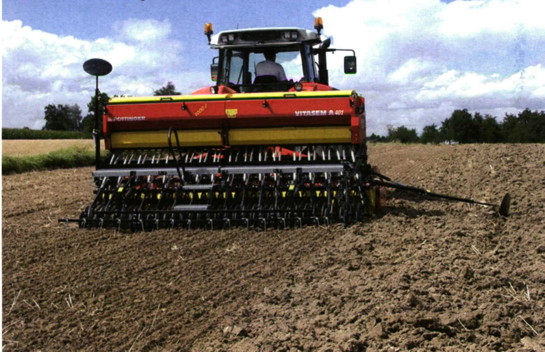
Foto 1. Sembradora convencional mecánica a chorrillo. Documentación Pöttinger.

Si nos centramos en las sembradoras convencionales monograno, su diseño se basa en la disposición de cuerpos de siembra independientes montados sobre un bastidor de forma que la distancia entre líneas se puede regular desplazando los cuerpos sobre dicho bastidor. Los cuerpos de siembra se disponen en número desde 2 a 12 con separaciones mínimas de 25 a 45 cm y máximas de 50 a 100 cm.