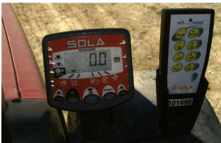
Foto 10. Sistema de control electrónico del funcionamiento de la sembradora.

fila, una separación entre rejas mayor de 75 cm.