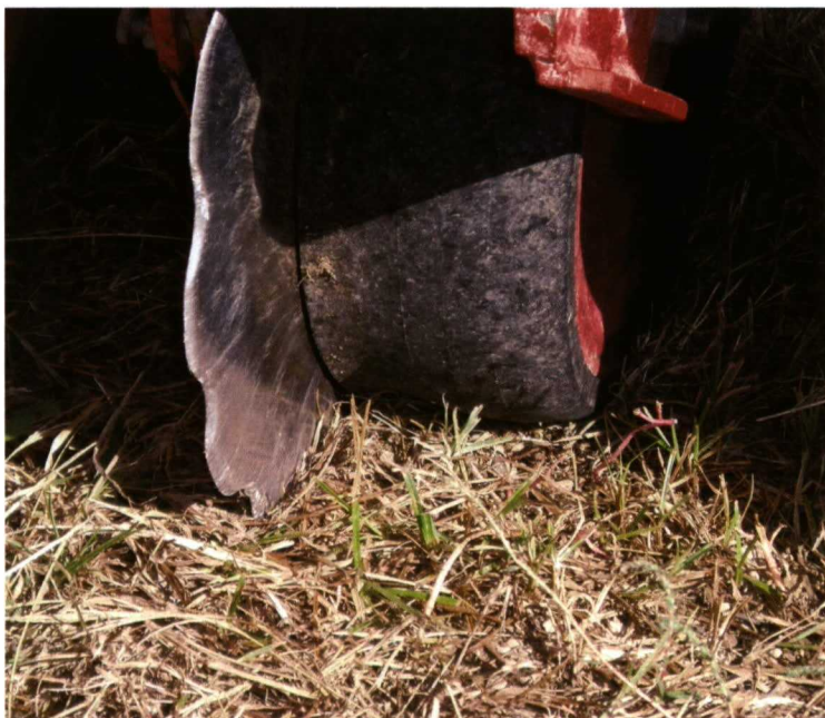
Foto 6. Sembradora de siembra directa con sistema de apertura de surco de disco simple.