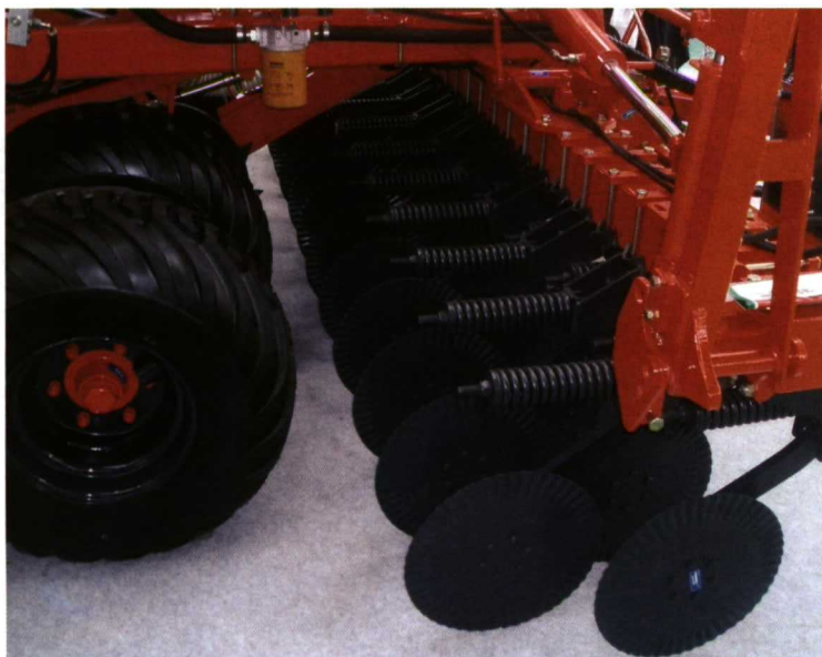
Foto 7. Disco de corte de residuos utilizado en trenes de siembra de las sembradoras de siembra directa.

de W. Ambos sistemas se pueden combinar conformando sistemas de apertura mixtos que aseguran una buena siembra en cualquier terreno y que disponen el sistema de doble disco por delante del patín. Como elementos de cobertura lo más habitual es disponer una rueda compactadora en cada cuerpo de siembra que puede ser metálica o de goma y de una sola pieza o dividida en dos mitades. Esta rueda permite regular