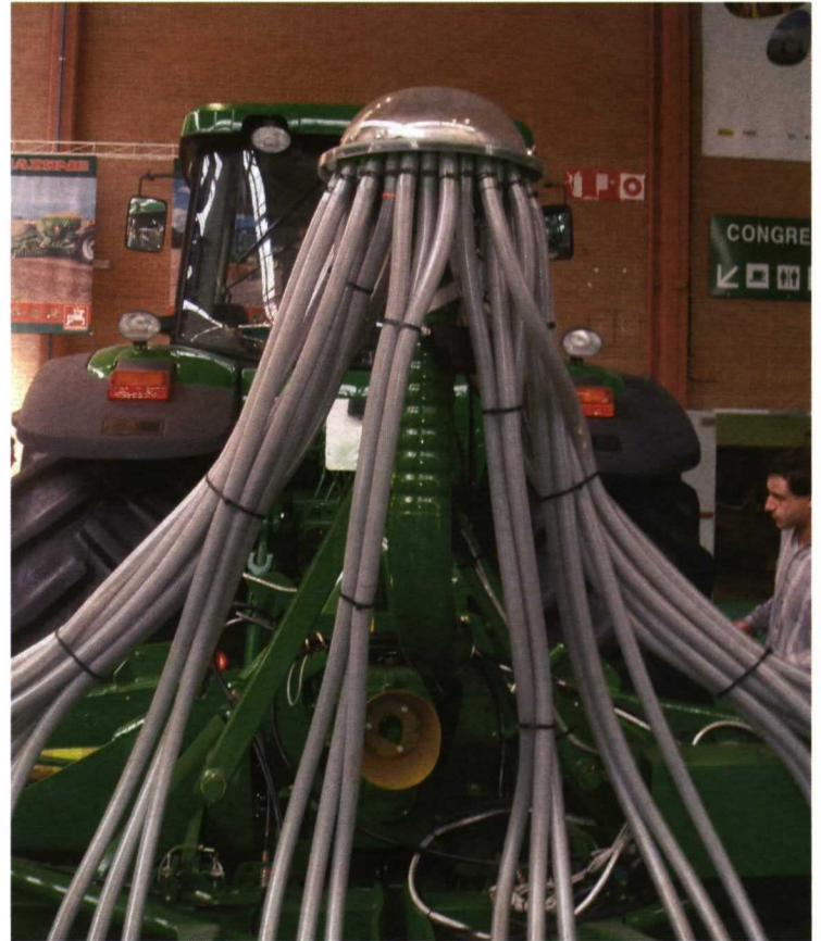
Foto 3. Sistema de dosificación centralizada con distribución neumática.

monograno se utilizan dos sistemas de apertura de surco: patín y discos. Los sistemas de patín se utilizan principalmente con maíz y remolacha y conforman un surco de siembra en forma de V, requiriendo suelos bien preparados. Para el caso de suelos mal preparados o con residuos se utilizan surcadores de disco doble que producen surcos en forma