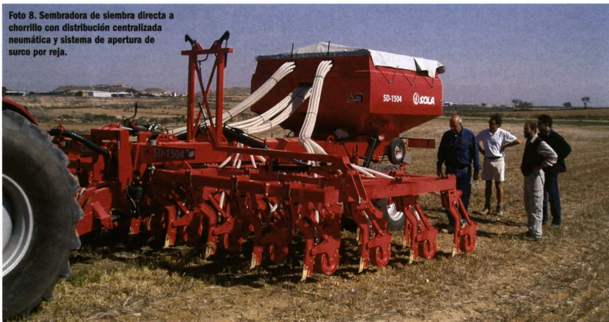
Foto 8. Sembradora de siembra directa a chorrillo con distribución centralizada neumática y sistema de apertura de surco por reja.