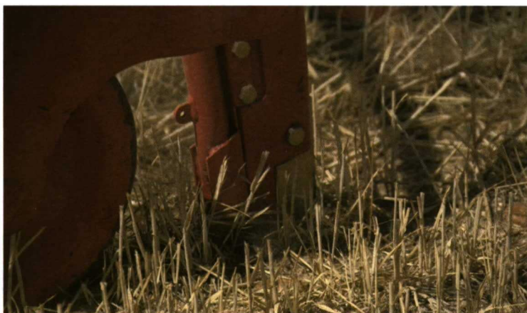
Foto 9. La reja, en comparación con el disco, se caracteriza por una mayor versatilidad de trabajo en terrenos húmedos y pedregosos, una mayor distorsión del terreno y un menor coste de adquisición y mantenimiento.