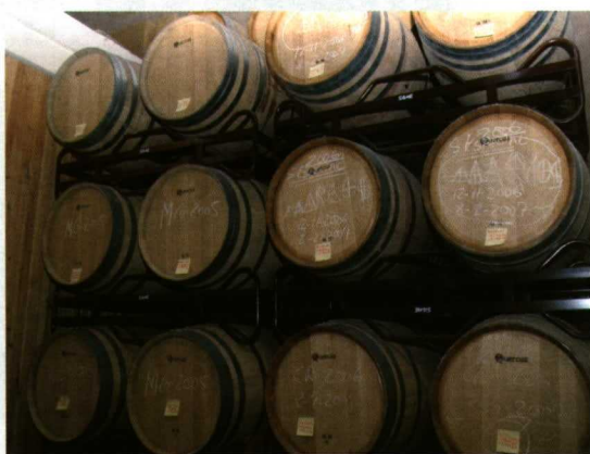
Algunas barricas de las 360 de roble americano y francés. Los vinos de crianza permanecen catorce meses en su interior.

Por la diversidad vitivinícola que ofrece la DO Ca Rioja, se da un crisol de producciones de uva y la vinificación de diferentes variedades. Según el proceso de envejecimiento, los vinos de Rioja pre-