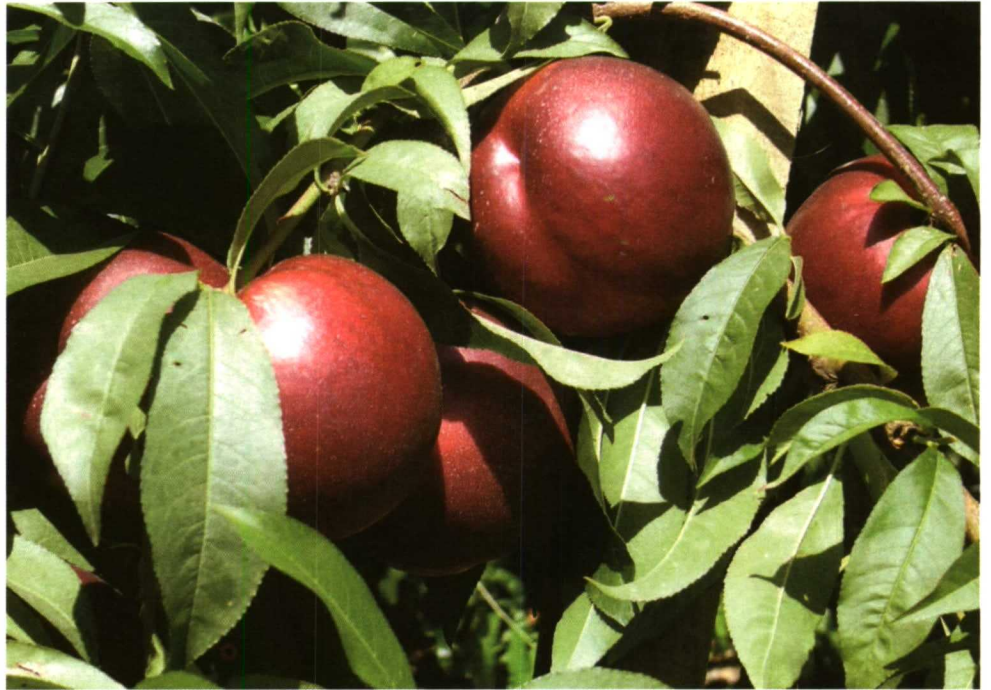
Productos como la nectarina soportan muchos costes y el agricultor necesita tener las espaldas cubiertas con un seguro en caso de siniestro.