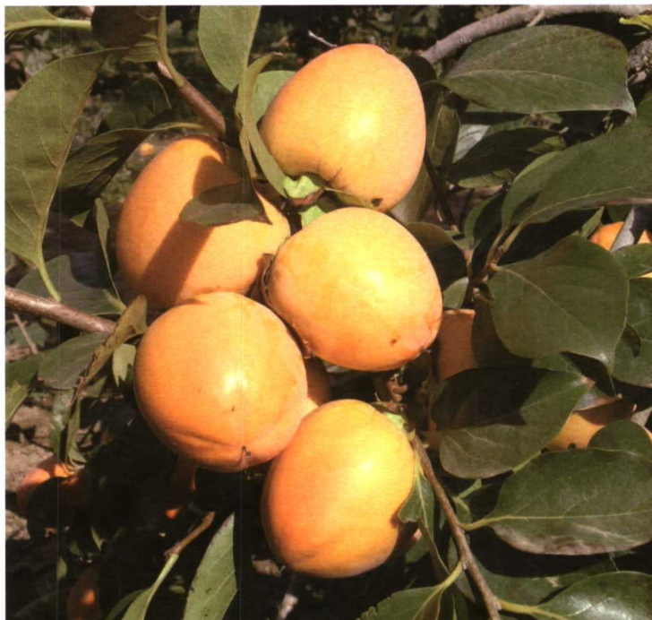
El kaki se lleva la mayor parte de los esfuerzos, sobre todo, en técnicas de cultivo y de postcosecha, hasta lograr 8.000-9.000 toneladas producidas al año.

Los socios piensan seguir asegurando sus cultivos, porque son conscientes de su necesidad y los contemplan como un gasto más derivado de su producción.