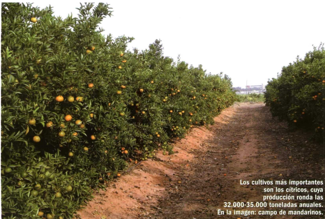
Los cultivos más importantes son los cítricos, cuya producción ronda las 32.000-35.000 toneladas anuales. En la imagen: campo de mandarinos.