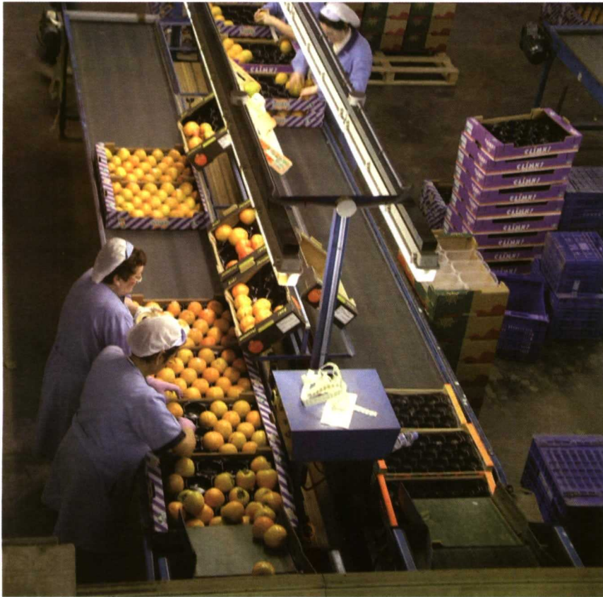
Línea confección de kaki. Tras entrar cada pallet en la central, se identifican mediante una etiqueta provista de un código de barras que refleja la trazabilidad.