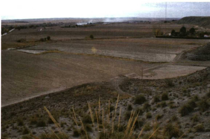
Un detalle de las 288 hectáreas de la zona de regadío en Estremera donde se racionalizado el tamaño de las parcelas.