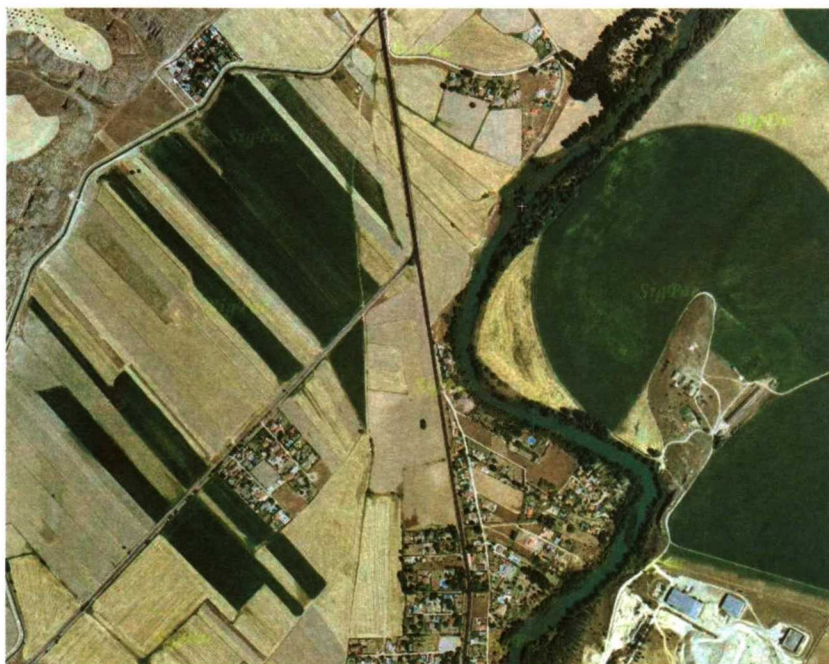
A vista aérea, se aprecia a la derecha del río, la tradicional zona de regadío de Estremera, cuyas parcelas se han agrupado para el ahorro de costes y el aumento de rendimientos.

Con las concentraciones parcelarias se persigue racionalizar la estructura de las explotaciones y mejorar la eficiencia, tratando de evitar la dispersión de parcelas pertenecientes a un mismo agricultor, dotándole con otras de las mismas o similares características, y de igual valor a las que tenía originariamente. Un claro ejemplo del éxito de este tipo de concentraciones es el municipio de Estremera que, ubicado al sureste de la Comunidad de Madrid, ha beneficiado a doscientos propietarios agrícolas de esta localidad.