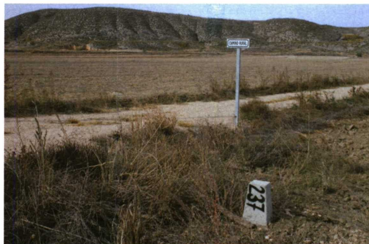
Junto al amojonamiento se ha acometido la construcción de viales y la red caminos rurales.

parcelaria que durante cuatro años se ha encargado de la reestructuración de las propiedades en todas sus vertientes y el acuerdo de concentración y amojonamiento de la fincas de regadío que se encuentra al sur del pueblo. Desde esta empresa se ha trabajado codo con codo con los agricultores, sin