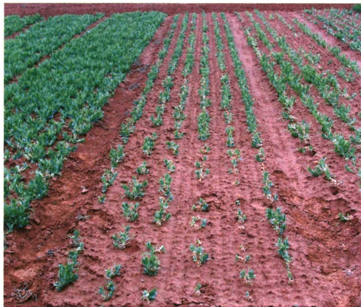
Foto 1. Comparación de los daños por supervivencia de una variedad relativamente susceptible a las heladas (izda.) con una verdadera variedad de invierno (drcha).

Sin embargo, y como ya muy bien saben aquellos agricultores que ya han sufrido la experiencia del guisante, el no conocer o respetar ciertas recomendaciones y la incidencia de diversos estrés propios de nuestra región, más cuando se consideran las siembras tempranas, suponen un riesgo que, de no conocerse o no tomar medidas para evitarlos o reducirlos, pueden llevar al traste las expectativas tan halagüe-