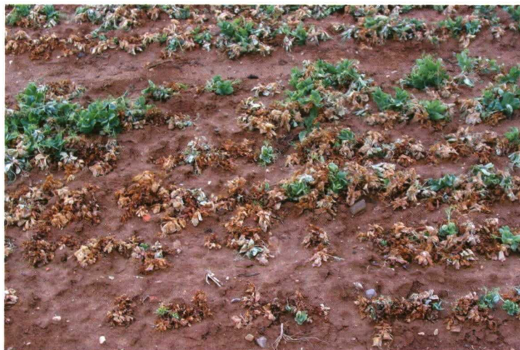
Foto 2. La bacteriosis puede causar más que notables reducciones en los rendimientos obtenidos, pudiendo producir pérdidas casi totales en ataques severos.

ñas que los párrafos anteriores parecen insinuar. Los más problemáticos detectados en condiciones reales de campo en nuestra región son los debidos a las heladas invernales, incluyendo las conocidas como tardías, y los daños ocasionados por algunas enfermedades como la grasa bacteriana, causada por la bacteria Pseudomonas syringae pv. pisi o la antracnosis, a veces conocida también como “rabia” del guisante.