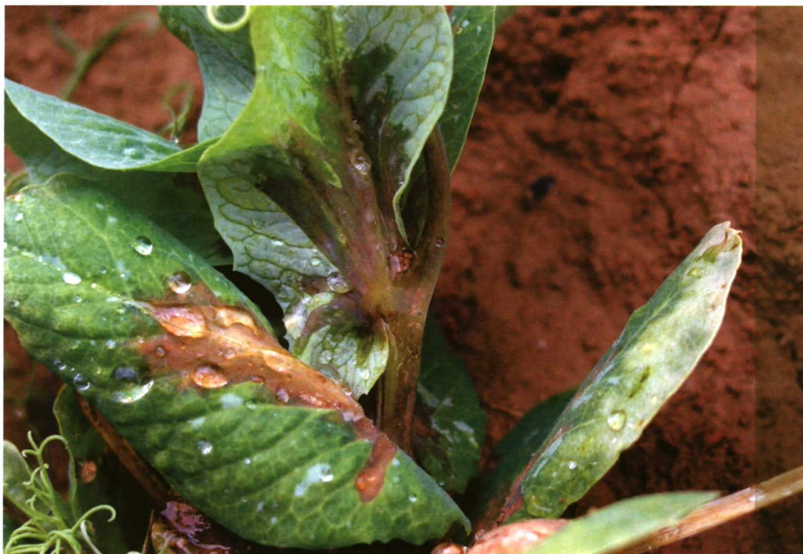
Foto 3. Los síntomas típicos de la bacteriosis son manchas de "grasa" que con el tiempo se vuelven más oscuras y más tarde de necrosan.

cultivo, defoliación y necrosis de flores y vainas. Como consecuencia, se dará una disminución en el rendimiento y calidad del cultivo.