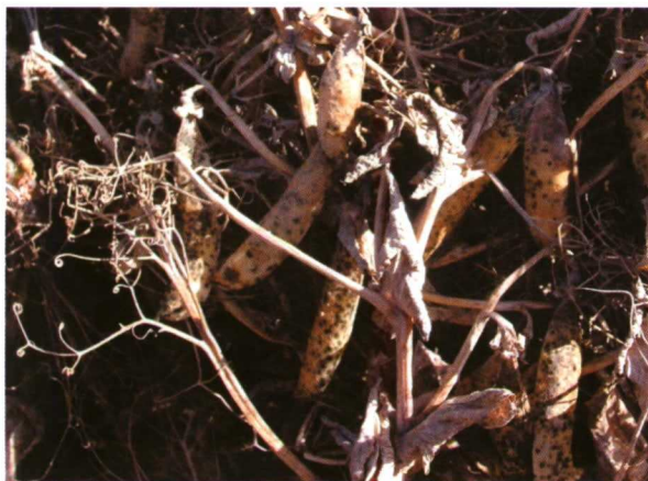
Foto 4. La rabia en general produce necrosis foliar, posible podredumbre de cuello y moteado de hoja y vaina, presentando lesiones oscuras circulares y ligeramente hundidas.

Los daños producidos por P. syringae facilitan la aparición y abundancia de los peritecios de M. pinodes .