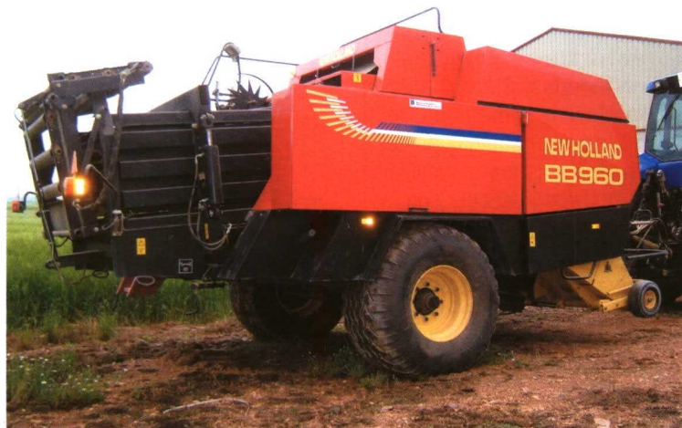
La empacadora BB960 de pacas rectangulares destaca por su gran capacidad de trabajo.

En la elección de la empacadora de su explotación, en Agroyagüe consideraron la necesidad de gran capacidad de trabajo y minimizar los tiempos muertos. Esto les llevó a elegir el modelo BB960 de pacas grandes rectan-