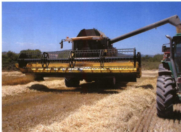
Cosechadora New Holland CX 840, propiedad de Agroyagüe.

En Agroyagüe, aprovechan la paja que obtienen en su propia explotación ganadera por lo que son exigentes con la cali-