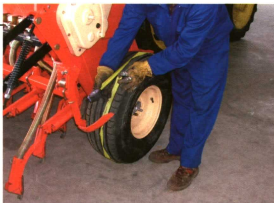
Foto 4. Longitud o desarrollo de la rueda motriz del dosificador.

• Medir directamente con flexómetro (foto 4).