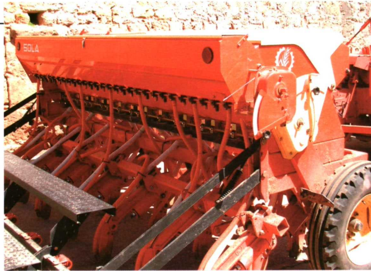
Foto 2. Abonadora de microgránulos sobre máquina de siembra directa.

Para calcular los kilos extraídos de la tolva, en campo, y de forma aproximada, se puede apoyar en el volumen de abono que ha descendido de la tolva y calcular los kilos por tener marcas de referencia en la tolva o por tener la referencia de lo que ocupan en la tolva, en su caso, el contenido de los sacos de abo-