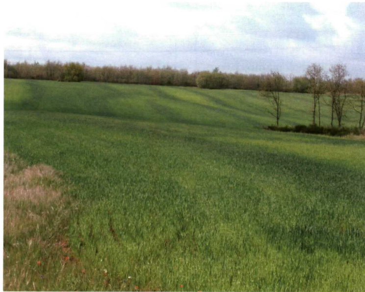
Foto 1. Detalle de distribución irregular y separación excesiva entre pasadas.

El objetivo del presente artículo es transmitir las opciones que tiene el agricultor en el campo para regular y mantener su abonadora a fin de procurar conseguir las mejores distribuciones. En esta primera parte se tratará la regulación de las abonadoras de gravedad y neumáticas, dejando para una segunda la regulación y mantenimiento de las abonadoras de proyección.