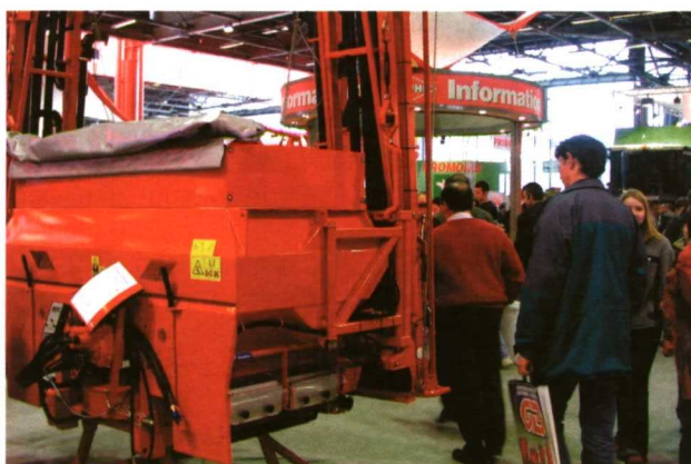
Foto 5. Abonadora neumática en exposición.

Las causas de las posibles desviaciones entre la regulación estática y la dinámica en parcela se suelen deber a problemas de deslizamiento de la rueda, hundi-