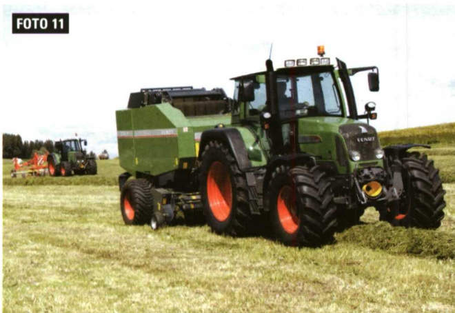
Foto 11. Las cajas de cambio han progresado paralelamente a los motores y su buena gestión colabora en el rendimiento global de las operaciones.