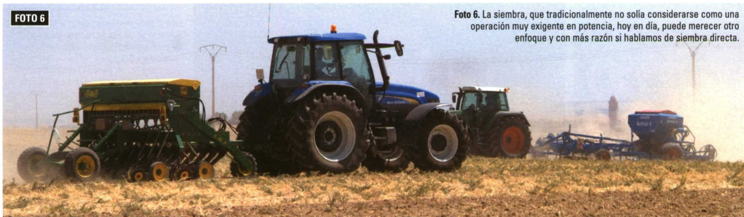
Foto 6. La siembra, que tradicionalmente no solía considerarse como una operación muy exigente en potencia, hoy en día, puede merecer otro enfoque y con más razón si hablamos de siembra directa.

Las cajas de cambio han progresado paralelamente y su buena gestión colabora en el rendimiento global de las operaciones. Los escalonamientos son amplios y suficientes, el número de relaciones llega a niveles muy elevados que exigen, prácticamente, la gestión electrónica del cambio combinada con la del motor. Muchas de estas relaciones, o algunos grupos de ellas, pueden conectarse bajo carga sin necesidad de pisar el embrague, y en algunos casos llegamos tam-