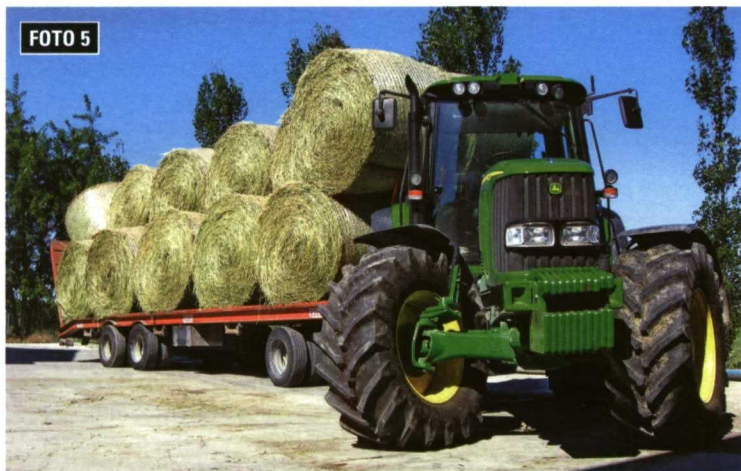
Fotos 4 y 5. En otras ocasiones el transporte puede ser el factor decisivo. Distancias a recorrer, características del recorrido (piso, cuestas, posibilidad de alcanzar elevadas velocidades), importancia del tiempo necesario, nos determinan la velocidad, y la potencia del tractor que vamos a necesitar.

CV, grosso modo , es muy amplia y variada y es posible hallar la potencia y el tipo más adecuados a las características de la finca y de las labores que en ella se realizan. Y hemos mencionado el tipo de tractor porque no todo es la potencia, evidentemente. Como norma general, la capacidad de tracción es el parámetro funda-