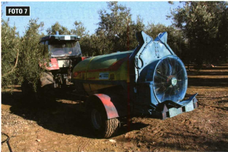
Foto 7. En algunas explotaciones las tareas con la toma de fuerza pueden ser predominantes, y ahí sí que 10 CV más o menos, pueden ser bien decisivos, porque el tractor suele tener que ir a un régimen elevado de revoluciones.

bién a la inversión bajo carga de la marcha, con un simple pulsador. Evidentemente son opciones que encarecen el producto y conviene, como hemos dicho para