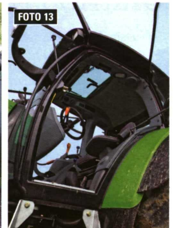
Fotos 12 y 13. El nivel de confort en las cabinas es máximo. Las suspensiones de cabina se han ido generalizando, el nivel sonoro conteniendo y la ergonomía general del asiento y los mandos están cada vez mejor estudiados.