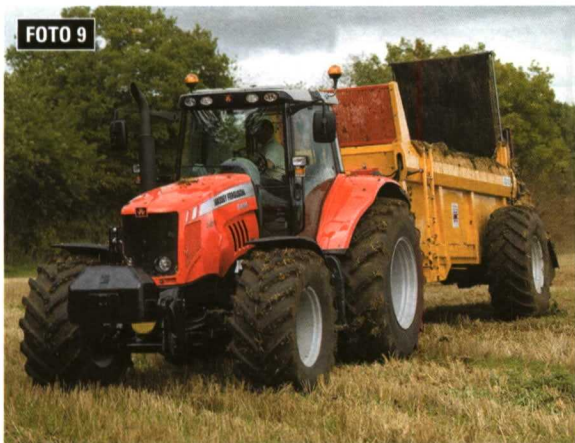
Foto 9. La electrónica y la informática han tomado cartas de naturaleza en casi todos los vehículos, y los tractores no podían ser menos, montando en algunos casos sistemas de gestión electrónica del motor.

Finalmente, mencionemos que el nivel de confort en las cabinas es máximo. Las suspensiones de cabina se han ido generalizando, el nivel sonoro conteniendo y la ergonomía general del asiento y los mandos está cada vez mejor estudiada, lo que redundará en una mayor facilidad en el trabajo y, por tanto, en un mejor rendimiento del mismo. ■