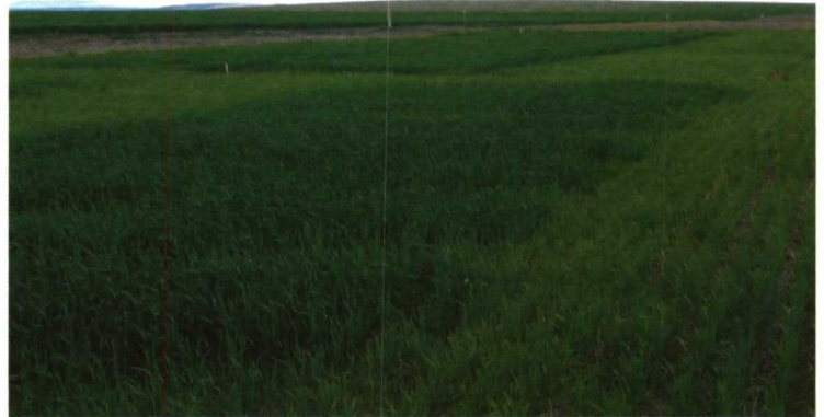
En la foto se aprecian los distintos tratamientos de fertilización.

Fertiberia inicia una nueva etapa en el mundo de las tecnologías de la información con la puesta en marcha de un nuevo portal con contenidos y servicios de gran interés para el sector agrícola.