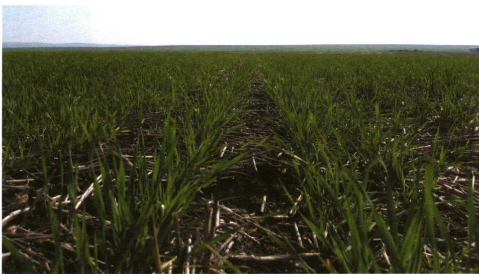
Ensayo de fertilización nitrogenada en siembra directa. Se puede apreciar el rastrojo del cultivo precedente.

El ensayo aquí descrito corresponde a la campaña 2005-2006, realizándose según los tratamientos reflejados en el cuadro I . Se establecieron en cuatro puntos de la geografía andaluza: Jerez de la Fronteira (Cádiz), Lebrija (Sevilla), Carmona (Sevilla) y Alhama de Granada. El diseño es de bloques al azar con tres repeticiones. La parcela elemental tiene un tamaño de 5,5 x 50 m. La siembra se realizó con una sembradora específica de siembra directa a chorrillo con distribución mecánica. La variedad utilizada ha sido de trigo duro y con el manejo típico