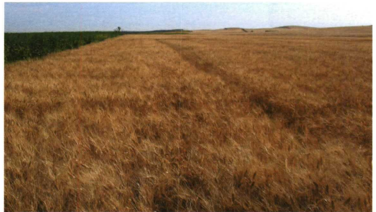
Parcelas de los ensayos en época de recolección.

Previo al establecimiento de los ensayos, se realizó un análisis del suelo de las parcelas, siendo características comunes el pH básico, el alto contenido en carbonatos y el bajo porcentaje de materia orgánica. Respecto a la textura, los situados en Jerez y Carmona son arcillosos y el resto, de textura franca.