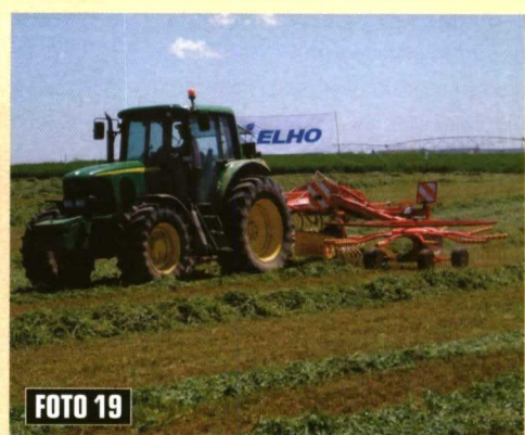
Foto 14. Regulador manual de la altura de trabajo del rastrillo TWIN 470-DH. Foto 15. Rastrillo hilerador TWIN 605-ED. Foto 16. Regulador de altura de los rastrillos de doble rotor. Foto 17. Sistema regulador de la excéntrica de los rotores. Foto 18. Brazos del rotor comandados por la excéntrica. Foto 19. Rastrillo hilerador TWIN 745-VS.

del tensor en cada una de las posiciones de la barra AI y AII.