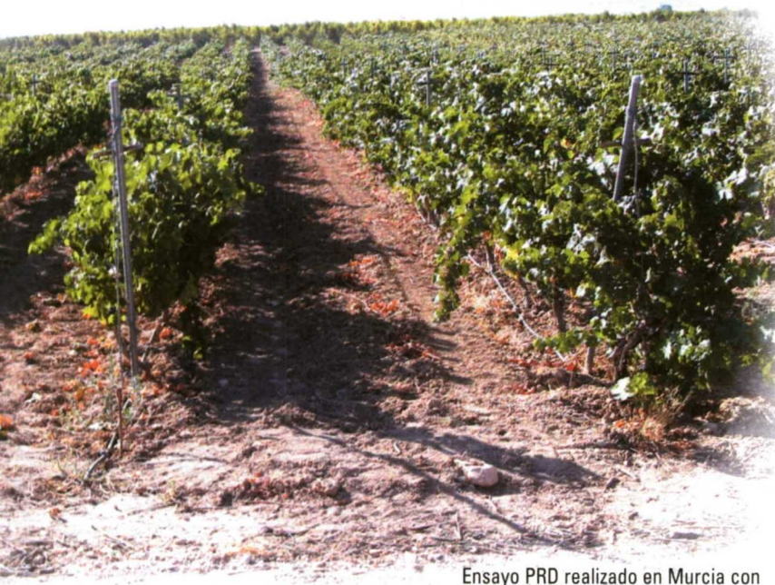
Ensayo PRD realizado en Murcia con las variedades Monastrell, Syrah y Tempranillo.

El riego deficitario controlado puede definirse como "la práctica de regular y restringir el agua de riego empleada en un cultivo, tratando de aplicarla en los momentos en los que su eficacia sea máxima, de acuerdo con los objetivos del cultivo".