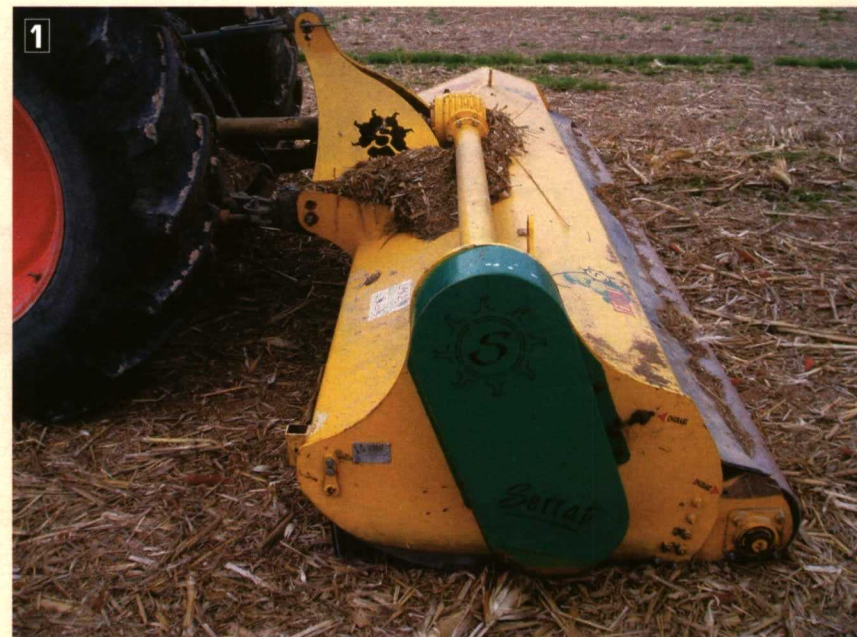
Foto 1. Picadora Serrat T-4000.

La producción de maíz fue de 12.000 kg/ha, por lo que el rastrojo se puede considerar representativo para este tipo de cultivo. El objetivo del picado y empa-