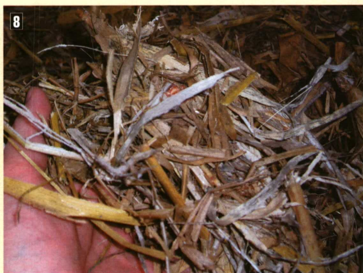
Foto 8. Resultado de la operación de picado.