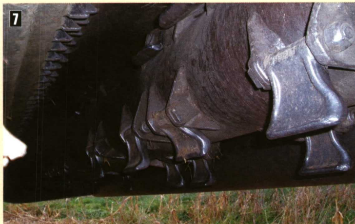
Foto 7. Detalle de los martillos de la picadora Serrat T-4000.