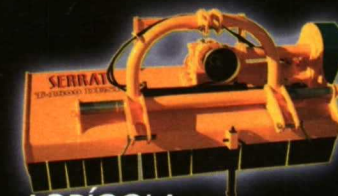
AGRÍCOLA PRO DESPLAZABLE