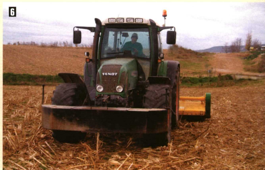
Foto 6. Operación de picado de rastrojo de maíz.

Una vez picado el rastrojo y distribuido uniformemente sobre la parcela se procedió a su hilerado utilizando un rastrillo hilerador de doble rotor Mur C-5400 traba-