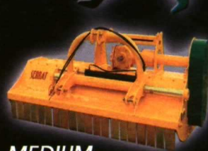
MEDIUM REVERSIBLE DESPLAZABLE