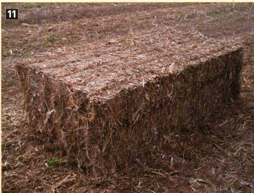
Foto 11. Resultado de la operación de empacado.

posterior de la empacadora evitando excesiva cantidad de producto en el pick-up.