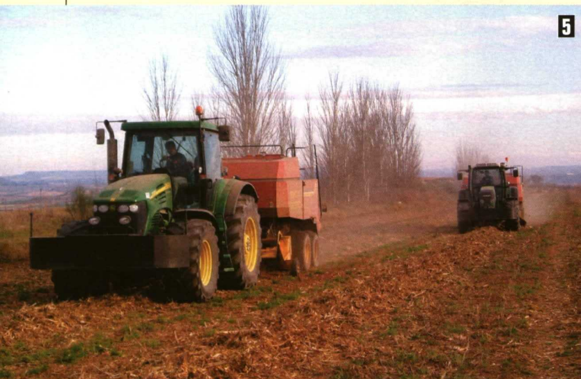
Foto 5. Empacadoras New Holland BB950 arrastradas por un tractor John Deere 7720 y un tractor Fendt 716 Vario.

da por la toma de fuerza y con transmisión lateral por correas al rotor de los martillos. Como es pertinente la máquina dispone de cortinas de protección que evitan la proyección de objetos. En la parte posterior dispone de un rodillo metálico de 28 cm de diámetro que permite nivelar la máquina y controlar la altura de trabajo.