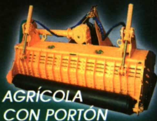
AGRÍCOLA CON PORTÓN

VISÍTENOS TECNOVID - OLEOTEC 07 PABELLÓN 6 - G - H STAND 19 - 22