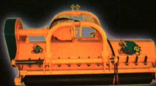
TRIGON REVERSIBLE DESPLAZABLE

VISÍTENOS CIMAG 2006 PABELLÓN 2 PARCELA F 6