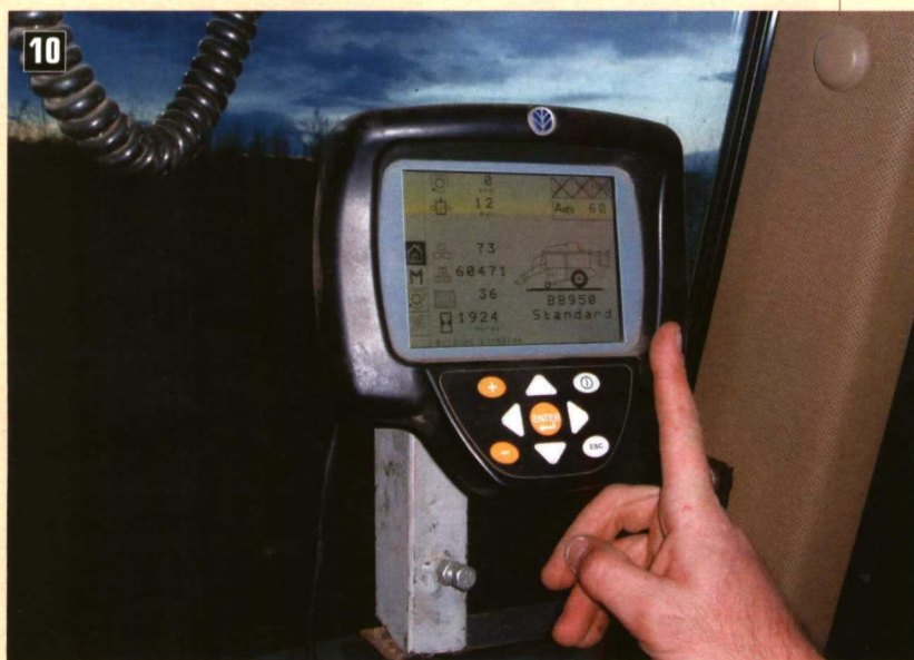
Foto 10. Consola de control InfoView en cabina para la empacadora NH BB950A.