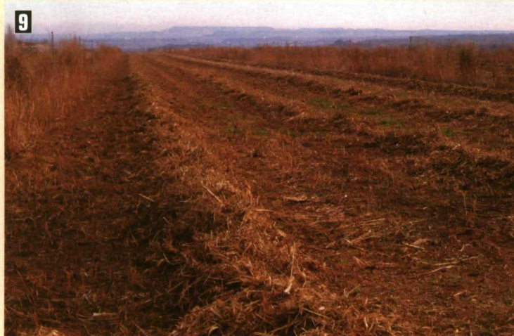
Foto 9. Resultado de la operación de hilerado.