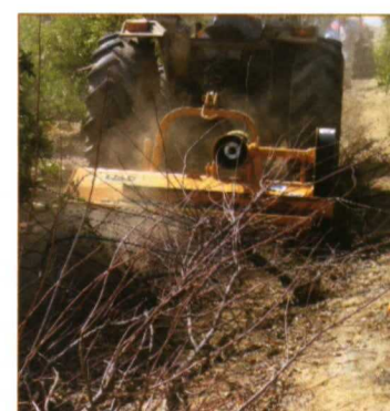
Trituradoras polivalentes con versiones reversibles.

7 gamas específicas que se adaptan a cualquier tipo de trabajo de trituración: