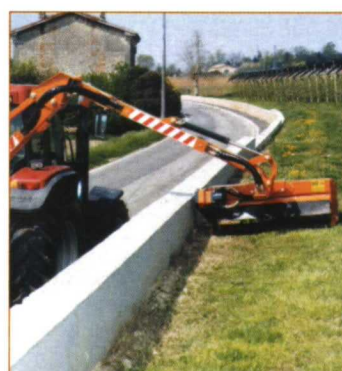
Desbrozadoras de brazo.