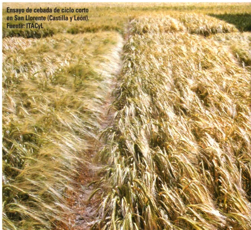
Ensayo de cebada de ciclo corto en San Llorente (Castilla y León).

riedad Donduro en las zonas templadas y de Catervo y Virgilio en las zonas frías.