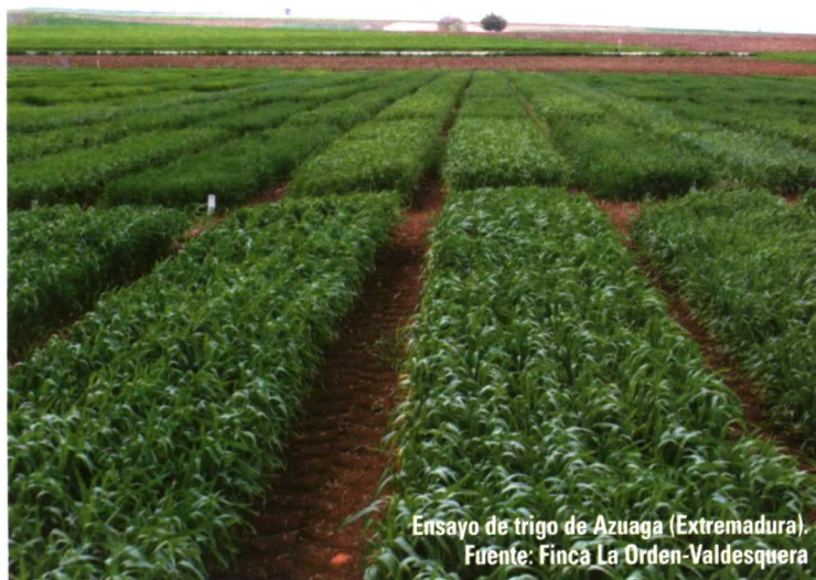
Ensayo de trigo de Azuaga (Extremadura).

La información facilitada por el grupo Genvce proviene de datos de ensayos realizados por entidades públicas y privadas de carácter autonómico de: