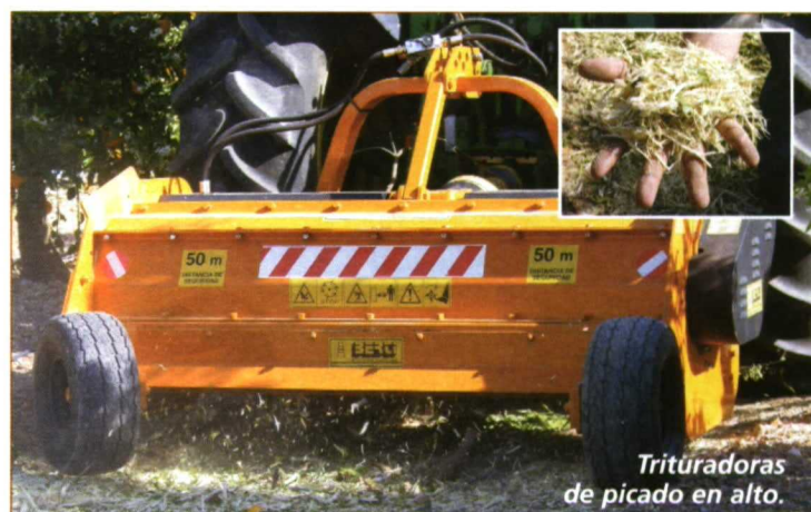
Trituradoras de picado en alto.