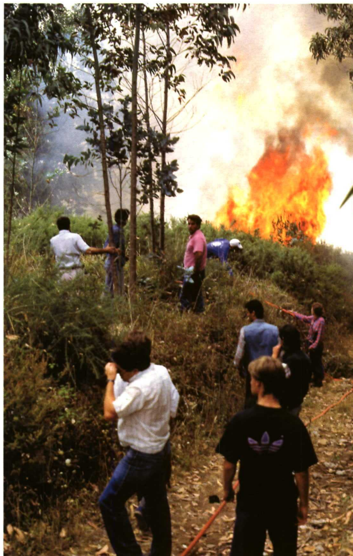
En el capítulo de incendios forestales se ha registrado durante 2006 un notable incremento en la contratación de seguros.

Asimismo, en 2006 también fueron menos las contrataciones de seguros para los cultivos de hortalizas, flores y plantas ornamentales. En conjunto, para estos cultivos se suscribieron 8.604