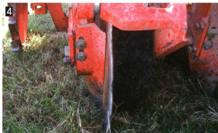
Rueda de control de la profundidad del disco de corte en el cuerpo de siembra de la SD-1203.