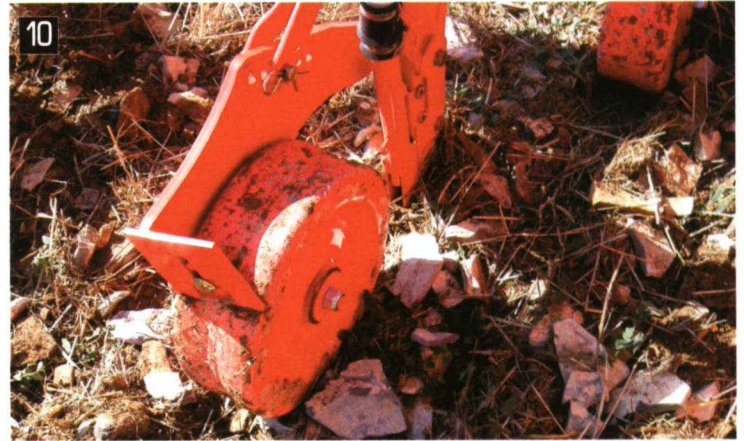
7. Sembradora SD-1203 mientras trabaja sobre rastrojo de cebada. 8. Detalle de distribución de semilla en siembra realizada con la SD-1203 sobre rastrojo de cebada. 9. Despeje de la sembradora SD-1504. 10. Rueda de tapado y regulación de profundidad en la SD-1504.

tas, desde el regulador situado bajo la tolva (foto 11).