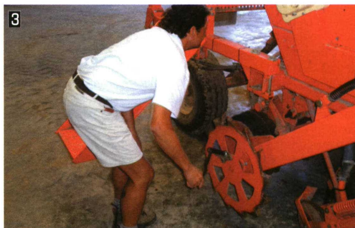
Estimación de la regulación requerida en el dosificador para establecer la dosis de siembra en la sembradora SD-1203.