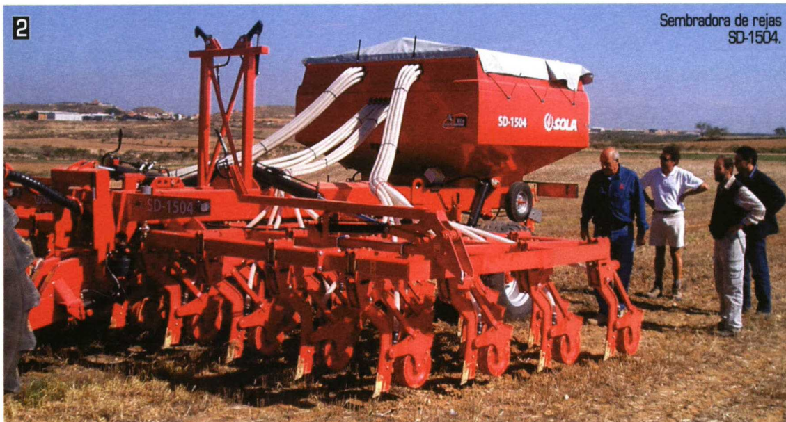
Sembradora de rejas SD-1504.