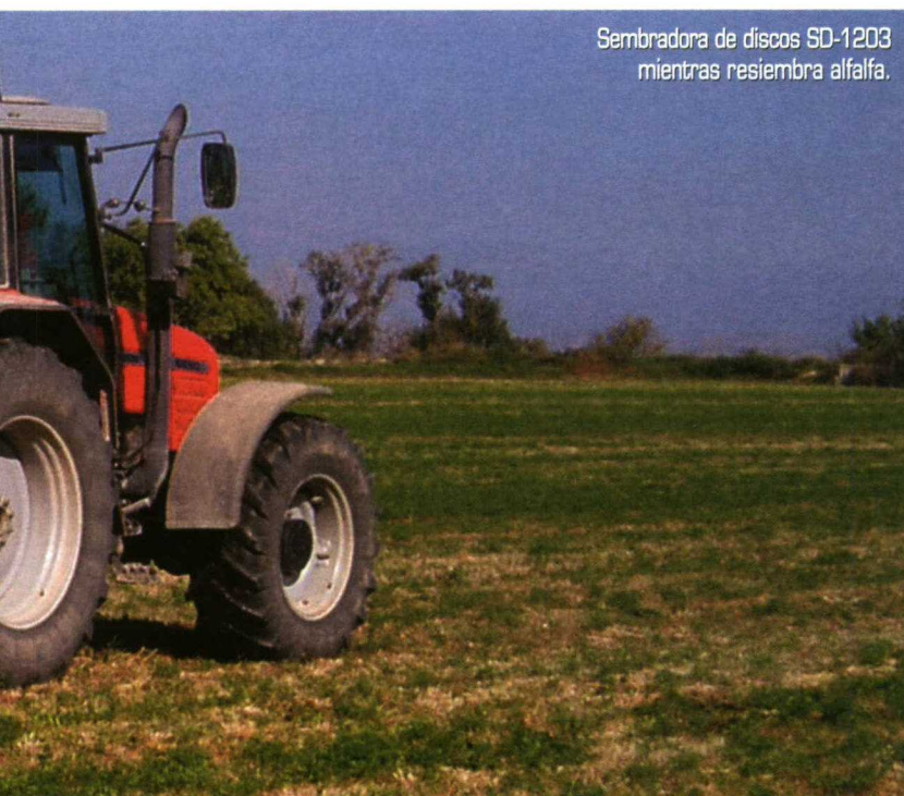
Sembradora de discos SD-1203 mientras resiembra alfalfa.