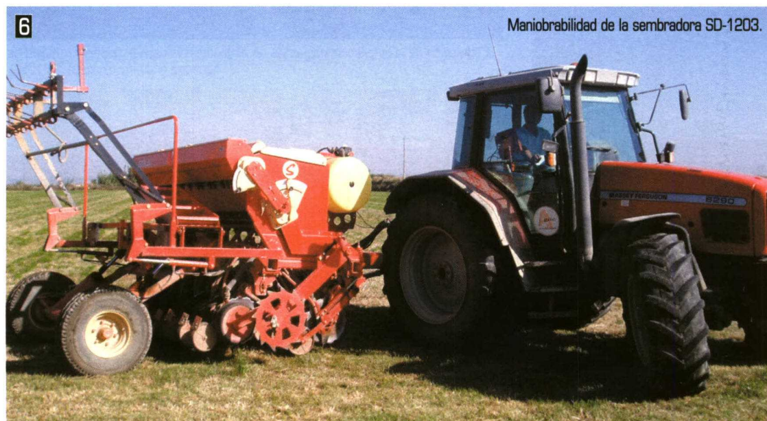
6 Maniobrabilidad de la sembradora SD-1203.

La dosis de siembra fue fijada cómodamente y de forma manual, sin necesidad de herramien-