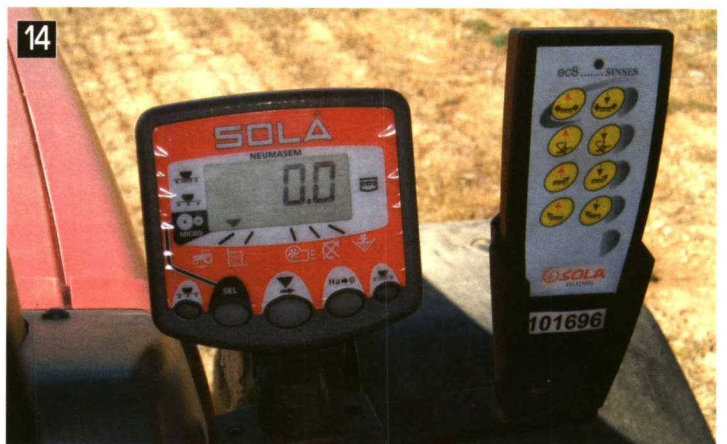
11. Sistema de regulación de la dosis de siembra, sembradora SD-1504. 12. Adaptación de la sembradora SD-1504 a un terreno pedregoso. 13. Aspecto de la parcela una vez realizada la siembra con la SD-1504. 14. Monitor y mando a distancia para el manejo de las sembradoras SD-1203 y SD-1504.

de elevado peso, en algunos casos puede transmitir esfuerzos excesivos al enganche con el tractor. Para ello, los fabricantes han ideado un sistema de suspensión neumático que amortigua los cabeceos de la máquina reduciendo el desgaste en la zona de enganche con el tractor.