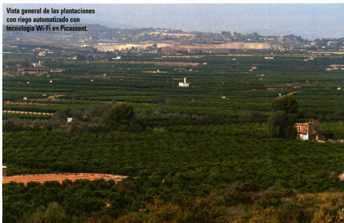
Vista general de las plantaciones con riego automatizado con tecnología Wi-Fi en Picassent.

A lo largo de estos años ya se han concluido parte de las actuaciones proyectadas en el Plan, pero aún queda mucho por hacer. Una buena parte de la superficie de regadíos española dispone aún de sistemas de riegos obso-