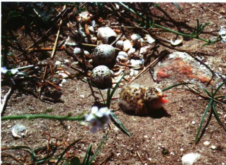
Con la implantación del FAS la UE pretende ayudar a los gestores a comprender la responsabilidad que asumen en el cuidado de la naturaleza.

El FAS puede ser operado por entidades públicas o privadas,