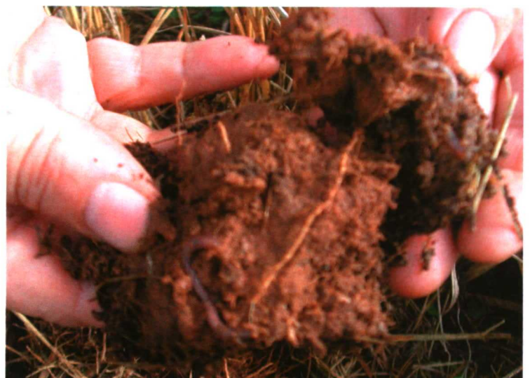
Uno de los objetivos de la condicionalidad es tratar de disminuir la erosión, y mantener el nivel de materia orgánica, la estructura y la biodiversidad de nuestros suelos.