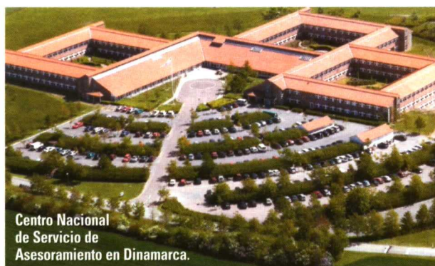
Centro Nacional de Servicio de Asesoramiento en Dinamarca.

Al comprobar la complejidad de todo lo expuesto, se comprende claramente la necesidad de la implantación de la ayuda FAS para conseguir que el gestor agrario no sólo comprenda la necesidad de todas las medidas adop-