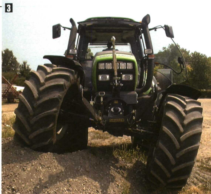
Foto 3. Algunos tractores con suspensión del eje delantero están dotados de control electrónico de la suspensión.

La ventilación en las cabinas de los tractores es un aspecto fundamental si se tiene en cuenta que este tipo de trabajo, realizado a la intemperie, produce en mu-