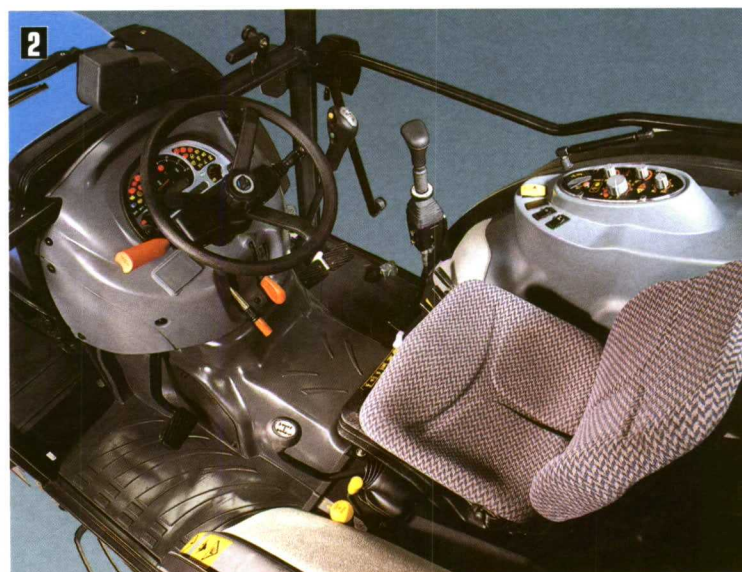
Fotos 1 y 2. Un asiento cómodo y seguro y la amortiguación del eje delantero, consiguen un entorno de trabajo saludable para el operario.

tractor de otro con diferencias de potencia pequeñas, como es el caso de tractores de 69 CV excluidos de este rango de potencia; no obstante, éste es un riesgo que