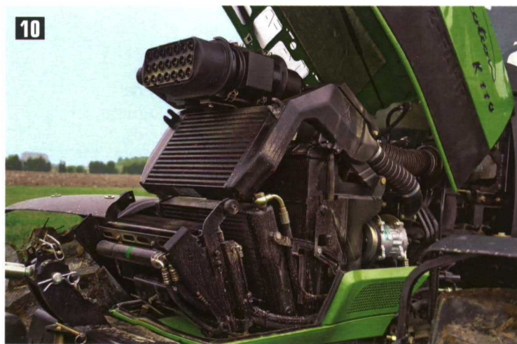
Fotos 9 y 10. El mantenimiento en los tractores es cada vez más sencillo, sólo con apretar un botón el capó se abre y quedan todos los elementos visibles.