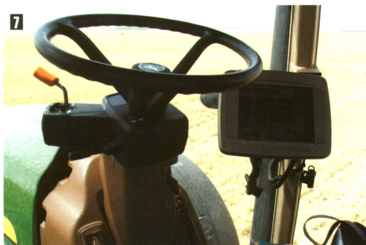
Fotos 6 y 7. Las consolas instaladas en los tractores tienen un software que permite gestionar la información de manera sencilla sobre datos del tractor y de la explotación.

sión continua no se puede hablar de número de velocidades de la caja de cambios, ya que en estos modelos la unión de transmisión mecánica con la hidráulica genera un número de velocidades infinitas dentro de un intervalo. Estos sistemas permiten seleccionar una serie de estrategias para optimizar el trabajo del motor, consiguiendo combinar la transmisión con el régimen de motor de forma óptima, conforme a la estrategia seleccionada y la velocidad de avance del tractor. Esto permitiría alcanzar el consumo óptimo para realizar una determinada operación a una cierta velocidad, en el caso en el que se seleccionara esta estrategia. Una cosa que es imprescindible en este tipo de estrategias es la carga, o porcentaje