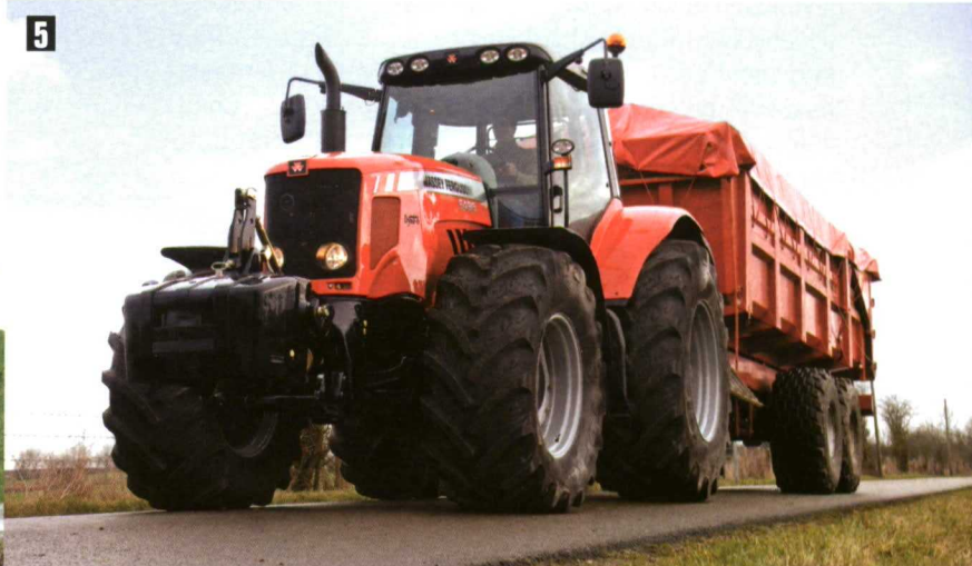
Fotos 4 y 5. Las transmisiones con variación continua permiten seleccionar una serie de estrategias para optimizar el trabajo del motor. Por ejemplo, permiten alcanzar el consumo óptimo para realizar una determinada operación a cierta velocidad.