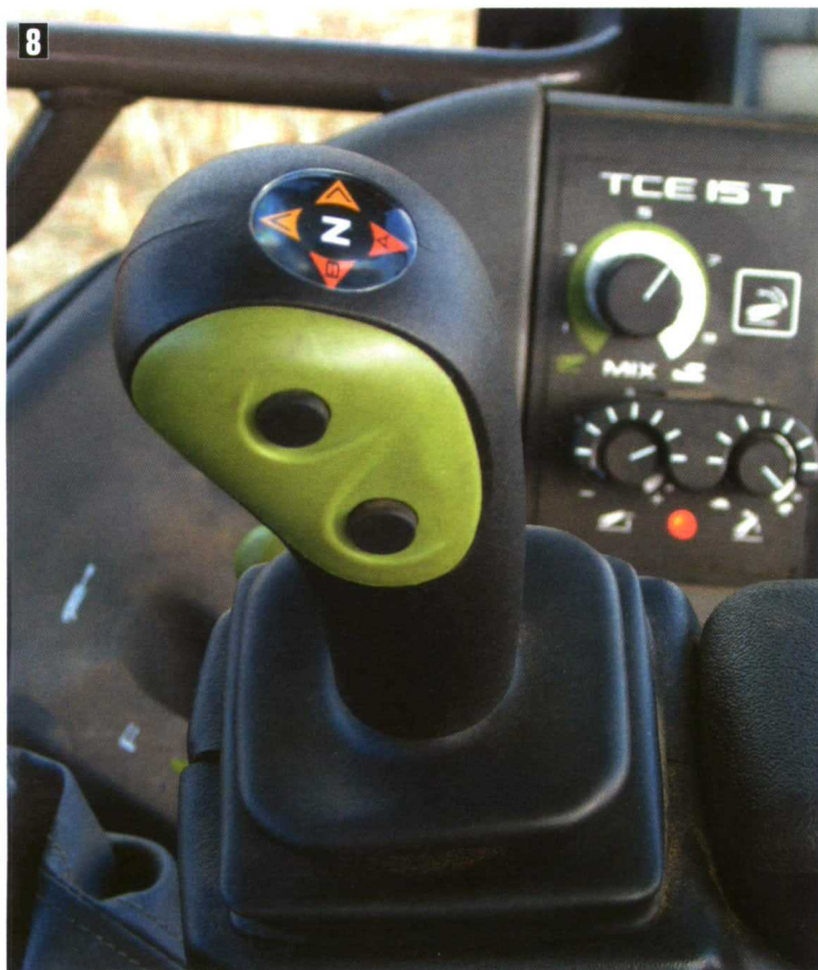
Foto 8. En muchos casos el cambio de marcha y el sentido de avance se controlan cómodamente desde un joystick.

memorizar estas operaciones desde una pantalla táctil. En el culmen de la automatización existe la posibilidad del autoguiado, que está limitada por la presencia obligada de un conductor en la cabina del tractor.