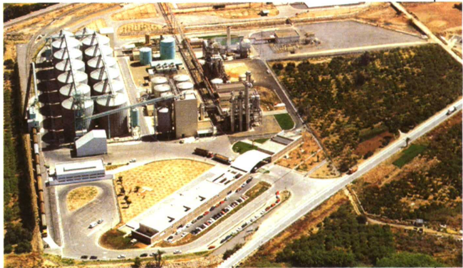
Planta de bioetanol para usos energéticos propiedad de Ecocarburantes del Grupo Abengoa.

bustible directo. Las materias primas se obtienen a partir de cultivos alcoholígenos que pueden ser productores de azúcar, almidón o celulosa, según el proceso que se emplee para la obtención del mosto azucarado previo a la fermentación alcohólica. En la actualidad, el bioetanol se está produciendo a partir de materias primas convencionales, tales como la remolacha, la caña de azúcar (en países tropicales) o el grano de cereales, pero es de esperar que en un futuro se desarrollen nuevos cultivos más adecuados y rentables para esta finalidad. Dos plantas industriales de 100.000 m 3 de producción anual de etanol cada una, ya están operando en nuestro país y una tercera entrará en producción próximamente (foto 2). Cada planta de éstas requiere un suministro anual de materia prima que produzca el equivalente a 200.000 t de azúcar. Si la base fuera cereal de secano, y teniendo en cuenta que para producir 1 litro de etanol se necesitan aproximadamente 2,7 kg de grano, sería necesario cultivar 100.000 ha de cereal de secano (producción media 2,7 t/ha) para poder abastecer completamente a una de estas plantas.