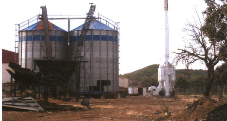
Central termoeléctrica alimentada con residuos forestales en Helechosa de los Montes (Badajoz).

les de biomasa y co-combustión y el resto (583 ktep) irían destinados a fines térmicos.