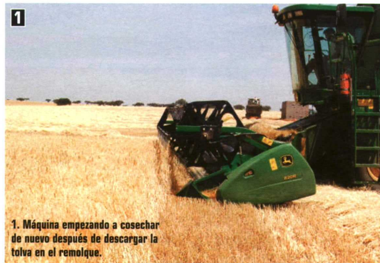
1. Máquina empezando a cosechar de nuevo después de descargar la tolva en el remolque.

En todos los casos, para cada uno de los cultivos, es fundamental hacer las regulaciones adecuadas de los distintos elementos, de corte, de trilla y de limpia. En ocasiones, incluso para el mismo cultivo y dentro de la misma parcela, es necesario