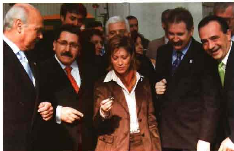
Un momento del paseo inaugural.

En esta ocasión, además, el centro de congresos albergó el primer encuentro empresarial para identificar oportunidades de cooperación entre Europa y América Latina en el sector de la maquinaria agrícola, integrado en el programa Al-Invest de la Comisión Europea, en el que durante dos días, representantes de un total de 77 empresas de ambos continentes, han mantenido reuniones bilaterales. La iniciativa ha sido considerada como un auténtico éxito, poniendo un broche de oro a una FIMA avalada por sus cifras. La próxima cita, del 12 al 16 de febrero de 2008, como siempre, en Feria de Zaragoza. ■