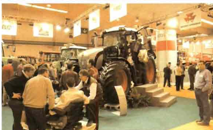
Todos los expositores han coincidido en destacar la notable afluencia de público con respecto a las ediciones anteriores.

afluencia de público desde el primer día y un considerable incremento de las operaciones comerciales con respecto a las dos últimas ediciones.