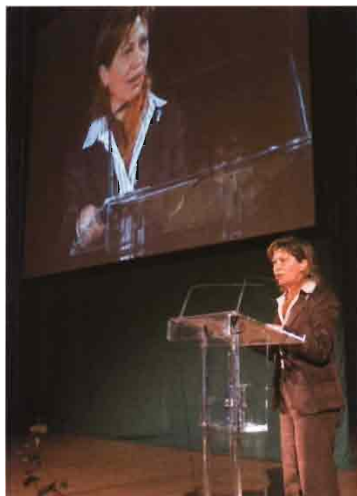
Elena Espinosa, ministra de Agricultura, durante el acto de inauguración.

vado a cabo el trabajo en esta edición, que calificó de "muy renovada". En su discurso inaugural y previo a la entrega de premios del Concurso de Novedades Técnicas que convoca FIMA Zaragoza –con más de una treintena de ga-