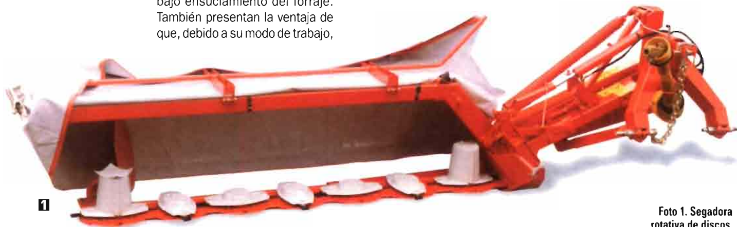
Foto 1. Segadora rotativa de discos.

Actualmente, de los cuatro tipos de máquinas expuestos, las que tienen una mayor cuota de mercado son las segadoras rotativas de discos ( foto 1 ). Este he-