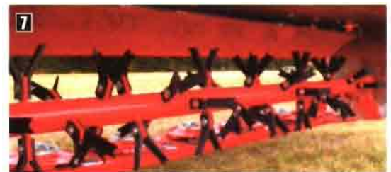
Foto 2. Barra de corte de discos triangulares con tres cuchillas.