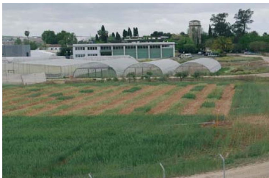
Foto 1. Vista panorámica del campo de ensayo de trigo en el que se aprecia la disposición en el campo de las parcelas elementales de los distintos tratamientos.

*El producto nº 26 tiene autorización de venta en Francia (nº 2090162).