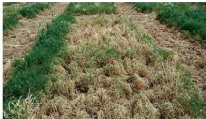
Foto 2. Distinto grado de eficacia en yeros en función de los productos formulados ensayados.