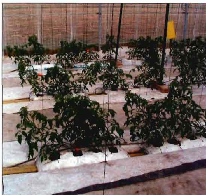
Fase inicial del cultivo de tomate utilizando como sustrato de cultivo fibra de pino.

cuarto ciclo. A altas tensiones, actúa igual que la fibra de pino y que la fibra de coco.