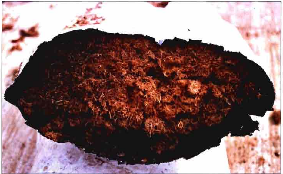
Detalle de un saco de cultivo con fibra de pino utilizado en los ensayos.

Departamento de Producción Agraria. Universidad Pública de Navarra.