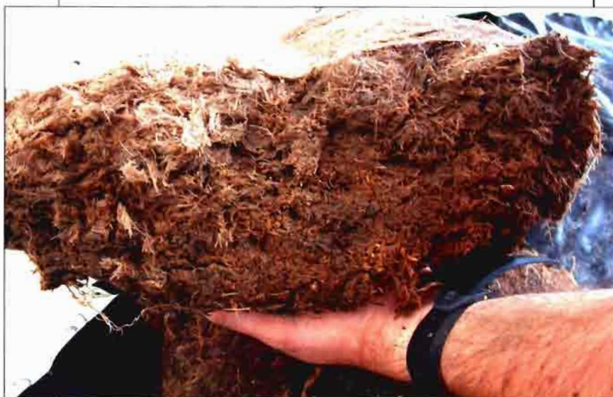
Fibra de pino.

Respecto a la perlita ( figura 1 ), al igual que la fibra de pino, con el uso reiterado poco a poco va perdiendo capacidad de aireación, aumentando el volumen de agua presente en ella. Esto es debido también a la disminución de macroporos, aunque en fibra de pino es un poco más pronunciado. Así, la perlita ofrece un buen volumen de aireación a -0,1 m de tensión, incluso en el