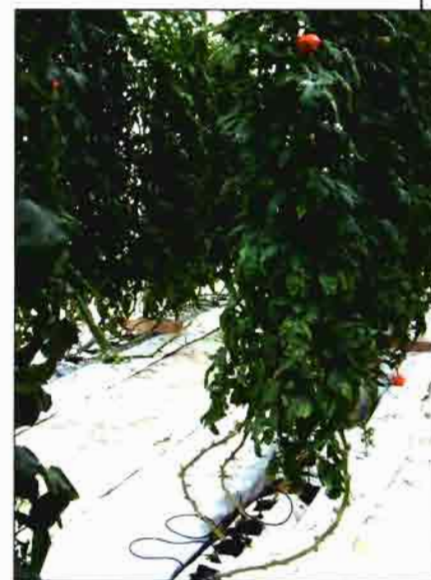
Cultivo de tomate utilizando como sustrato de cultivo fibra de pino.

En los frutos de los cultivos de tomate, el contenido en sólidos soluble ( o Brix), aumenta en todos los tratamientos con el transcurso de los ciclos, pero siempre manteniéndose dentro del nivel óptimo propuesto por Segura (1995) ( cuadro III ).