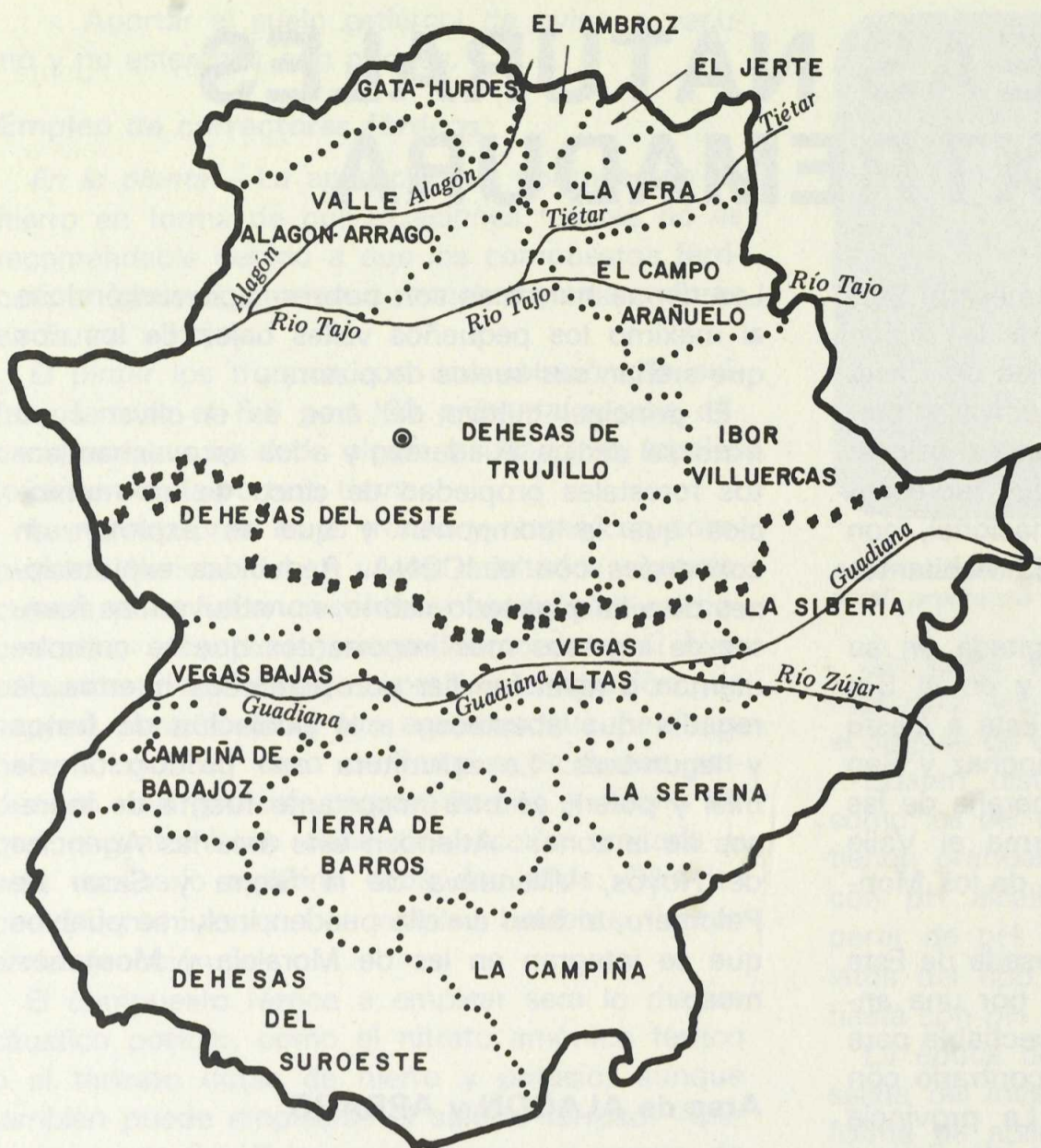
Identificación esquemática de las áreas naturales de Extremadura.