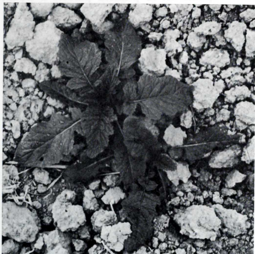
Brassica nigra en estado de roseta.