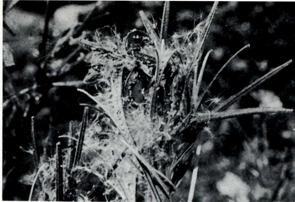
Epilobium parviflorum, en el acto de dispersar sus semillas voladoras.

A pesar del laboreo continuado y de la aplicación sistemática de herbicidas, las malas hierbas continúan apareciendo en los campos cultivados obligando a una lucha continúa contra ellas. Solamente en los casos de incultivo de plantas leñosas puede lograrse una erradicación casi total por medio de los herbicidas.