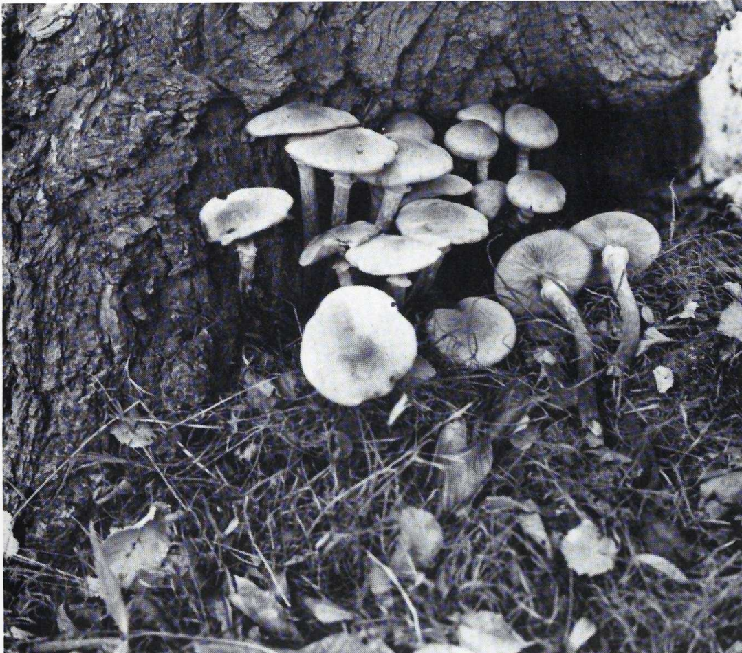
El hongo Armillariella mellea que causa la podredumbre de las raíces figura entre las especies que pueden ser combatidas por el Trichoderma viride .

De la misma manera P. Davet y A. Beyries han estudiado la lucha contra Sclerotinia minor en la lechuga, mediante la utilización de un hongo parásito de los esclerocios. Los primeros resultados obtenidos son muy buenos, pero queda por averiguar si el hiperparásito puede resistir a la microflora de los suelos hortícolas.