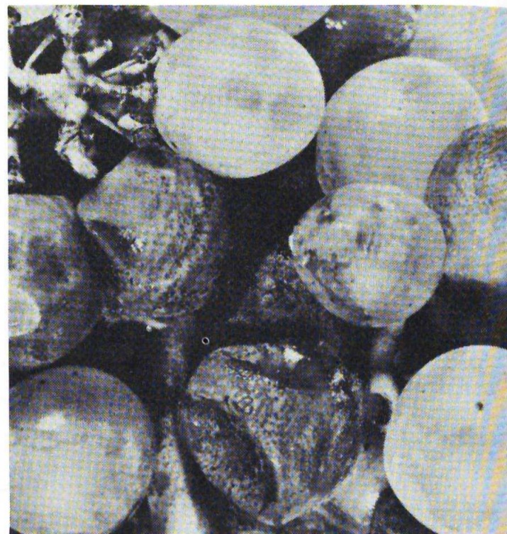
Hoja y frutos de vid afectados de excoriosis.