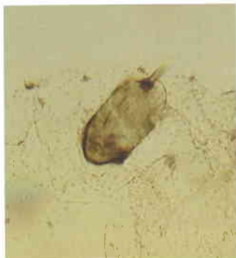
Figura 6. Ovo de Anagyrus pseudococci (Girault) encapsulado (24 horas após a postura).

A taxa de encapsulação agregada observada foi baixa, oscilando entre 0% e 22,2%,