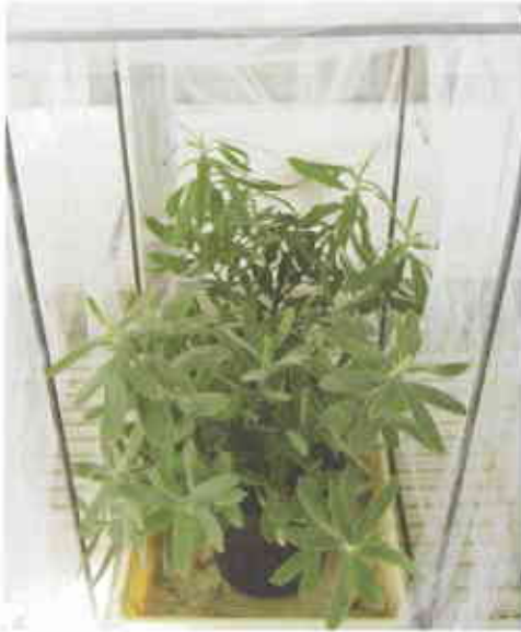
Figura 3. Gaiola contendo duas plantas envasadas do género Leucospermum (unidade experimental).