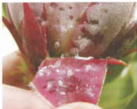
Figura 1. Cochonilhas-algodão instaladas entre as brácteas da flor de Protea cynaroides L.

As criações de cochonilhas foram iniciadas a partir de ovos provenientes de sacos ovíferos de fêmeas recolhidas em proteáceas, na Zambujeira do Mar (Alentejo - Portugal). As cochonilhas foram mantidas em plantas envasadas do género Leucospermum , uma vez que a sua manutenção em brotos