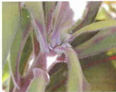
Figura 2. Cochonilhas-algodão instaladas no ápice vegetativo de Leucospermum var. "Scarlet Ribbon".