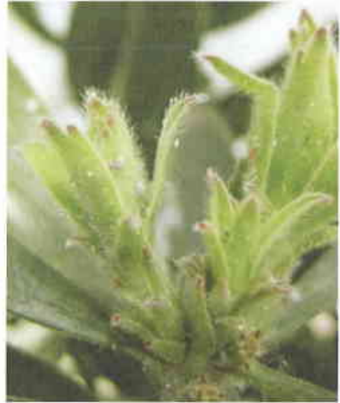
Figura 4. Pormenor do ápice vegetativo de Leucospermum sp., na unidade experimental, infestado por cochonilhas-algodão.

de batata (caules estiolados de Solanum tuberosum L.) se mostrou difícil. As plantas foram colocadas, duas a duas, em gaiolas com 40x50x60cm envolvidas por tulle, em estufa de vidro não climatizada.