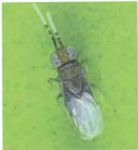
Figura 5. Fêmea adulta de Anagyrus pseudococci (Girault) (2-3mm) (Original de Mil-Homens).

cerosas que não permitem a visualização da cápsula melanizada que envolve o ovo ou larva encapsulada do parasitóide (Figura 6). Assim, antes de se proceder à dissecação de cada exemplar, efectuada ao microscópio estereoscópico (10 a 40x), com auxílio de pinças entomológicas, submetem-se as cochonilhas a um processo de clarificação, por imersão numa solução 1:1 de fenolcloral e ácido acético, durante 24 horas.