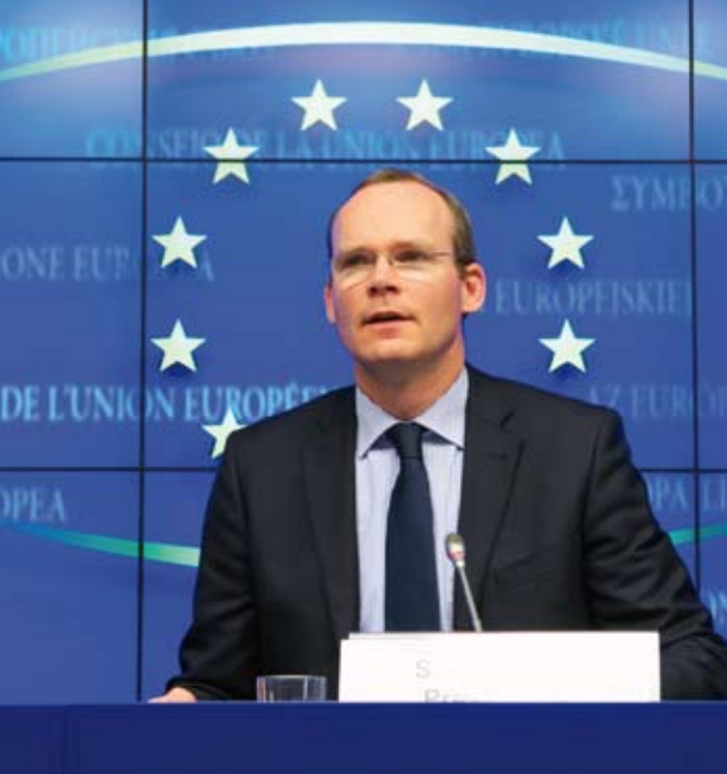
La comisaria Damanaki y el presidente de turno del Consejo, Simon Coveney, durante la presentación de los resultados de la reunión del pasado 13 de mayo.