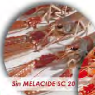
Sin MELACIDE SC 20

Aditivos Alimentarios y Coadyuvantes Tecnológicos para el Tratamiento de Productos de la Pesca y la Acuicultura