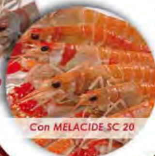
Con MELACIDE SC 20