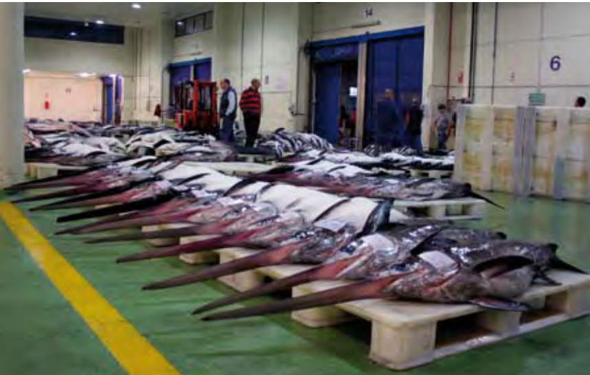
El pez espada es la principal especie para la flota española de palangre de superficie.