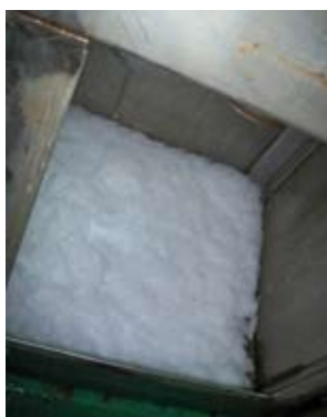
Arriba, el buque Cachacho, en el que se realizó la campaña. A la izquierda, máquina de hielo en escamas.