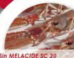
Sin MELACIDE SC 20