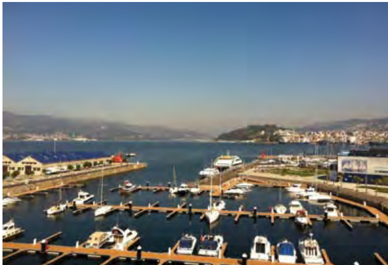
En esta imagen y en la de abajo, la nueva dársena del puerto deportivo de A Laxe.

De una o de otra manera, la directiva del