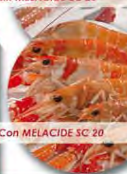
Con MELACIDE SC 20