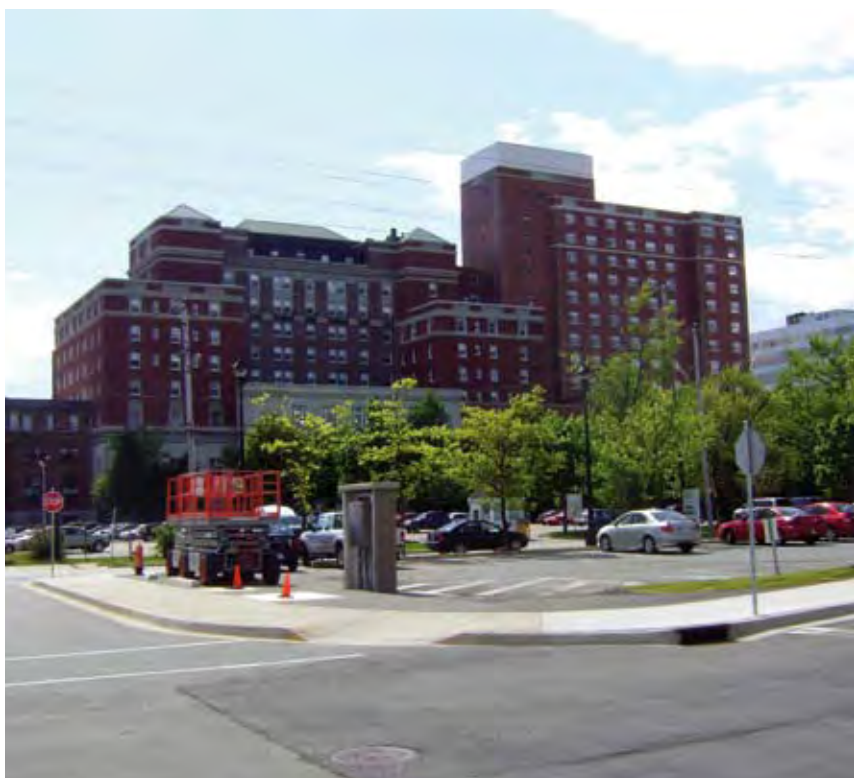
La reunión tuvo lugar en el hotel Westin Nova Scotia de Halifax.

Otro aspecto preocupante de los resultados de la reunión es que la flota española no dispondrá de las mismas posibilidades de compensar sus pérdidas con especies alternativas, como la raya. ⚓