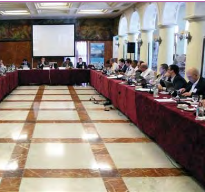
Aspecto de una reunión del Consejo Consultivo Regional de Larga Distancia (LDRAC).