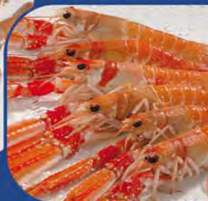
Con MELACIDE SC 20