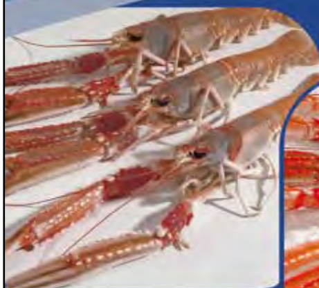
Sin MELACIDE SC 20