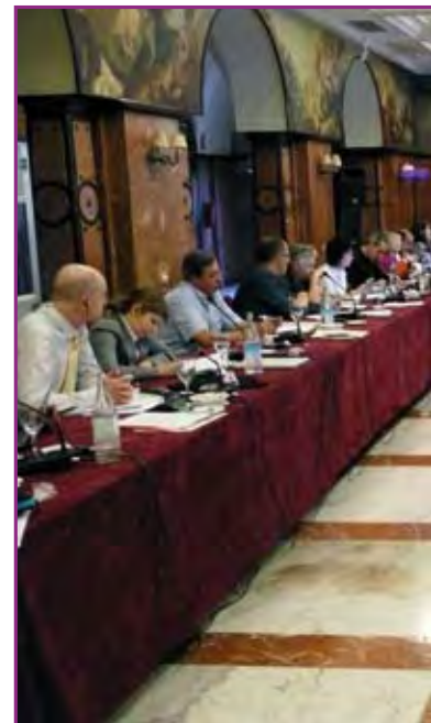
(Viene de pág. 10)

La utilidad real de los CCR en la actualidad está muy limitada, a pesar de que hasta la fecha hemos dado multitud de muestras de nuestro potencial, pero la actitud de la Comisión nos impide desarrollarlo. Un cambio en esta actitud sería lo deseable, más incluso que el (muy necesario) aumento de financiación. ↴