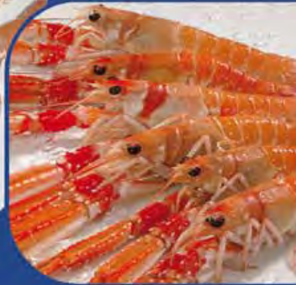
Con MELACIDE SC 20