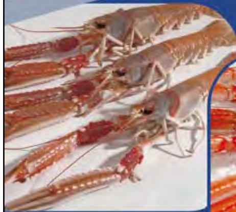
Sin MELACIDE SC 20