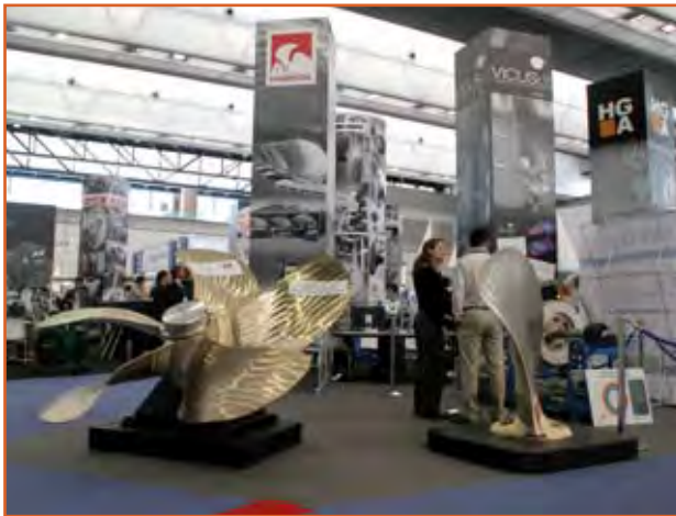
Tres imágenes del espacio de expositores de Navalia 2010, en el Instituto Ferial de Vigo.