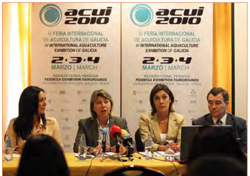
Imagen del acto de presentación de ACUI en la Consellería do Mar.