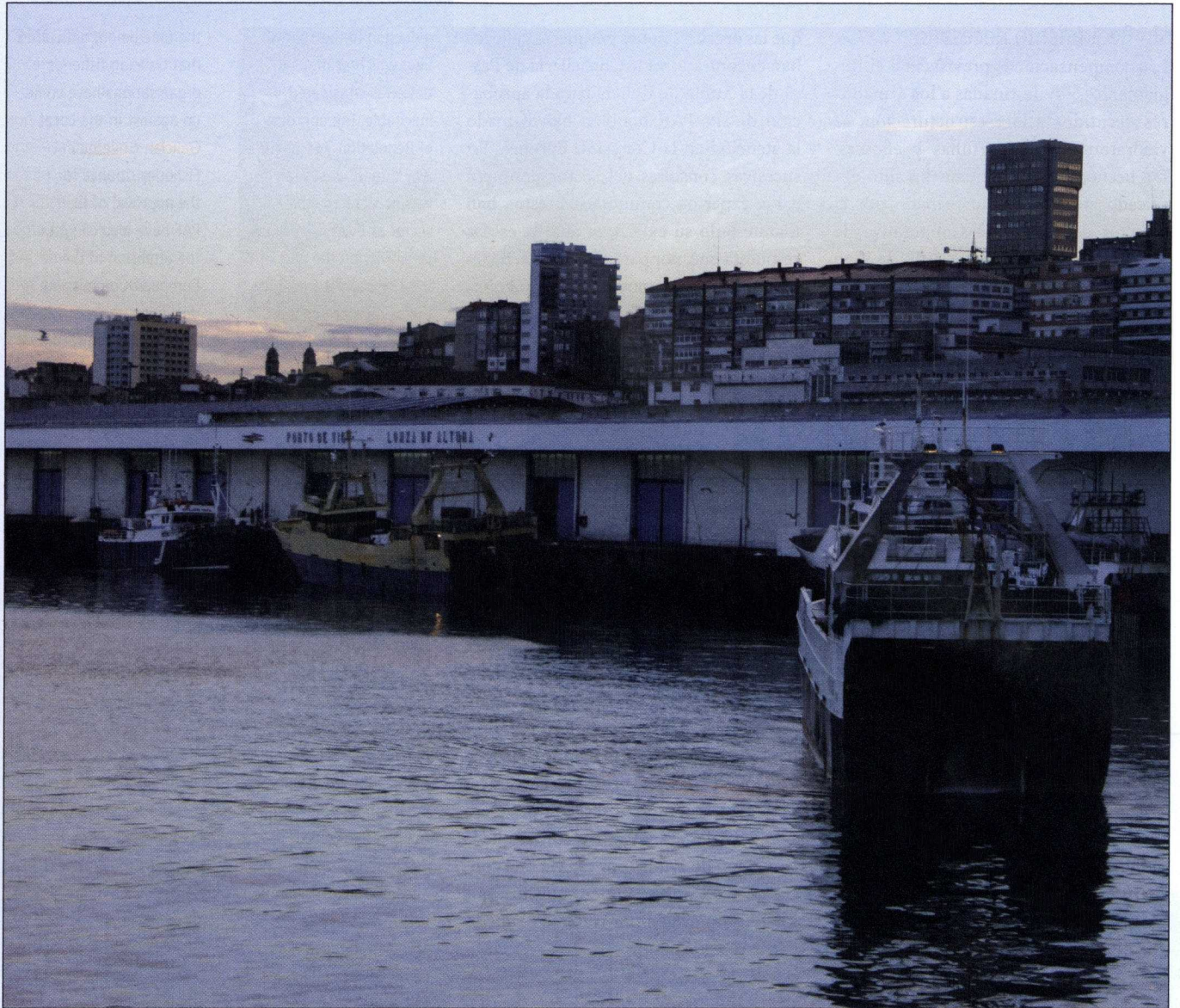
El sector elabora planes de ajuste de flota para abordar con realismo el futuro de la actividad.

The procedures of the Fleet Adjustment Plans (FAP), a financial instrument provided in Regulation 744 to aid the permanent withdrawal from the activity of fishing vessels, have met with important obstacles from certain Spanish Administrations for their approval. In fact, the FAP were considered by the Spanish fisheries sector as one of the most efficient tools for the readjustment of the size of the fleet to