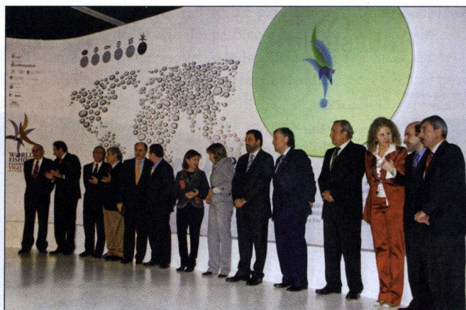
Foto de familia antes de la presentación oficial de la World Fishing Exhibition. La nueva edición, la sexta que se celebra en Vigo, tendrá lugar del 16 al 19 de septiembre en IFEVI.

Vigo acogió por primera vez la WFE en el año 1973. Fue la primera vez que la muestra salía de las islas británicas. Hasta ese momento, la exposición se había celebrado cinco veces en Londres y una en Dublín. ↴