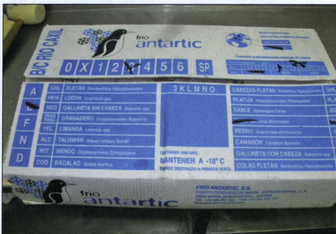
Un envase de productos pesqueros con una clasificación de especies de distintos caladeros.

The present situation is that, unlike other food industries, the extractive fisheries sector lacks standardisation in the nomenclature of hauls and neither are there many common criteria with regards to formats,