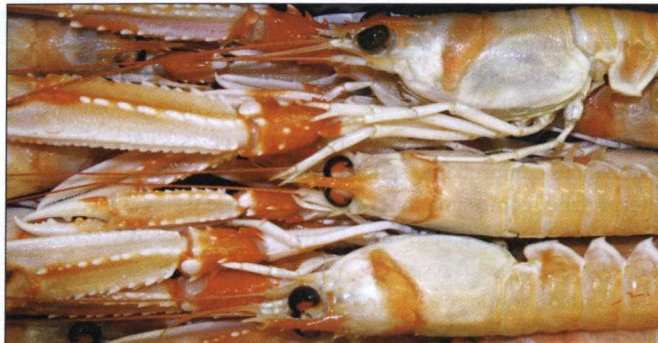
Los pescadores galos elevaron la talla mínima de la cigala.

Representantes de la Plataforma Tecnológica Tecnopeixe analizaron la experiencia de la organización francesa “ Ar. Mor Glaz ” (Mar Azul y Verde), en las que están implicados 260 buques de altura y gran altura de la Bretaña y que de manera voluntaria han asumido un conjunto de prácticas de protección del medio ambiente marino, más exigente que la norma comunitaria en esa materia. La iniciativa se denomina “Contrato Azul” y tiene como marco la Política de Conservación, Medio Ambiente y Salud de la DG-Mare de la Comisión Europea. En una reunión que se produjo en la sede de CETMAR-Fundación del Mar en diciembre pasado, miembros de la organización gala explicaron que en la cooperativa “ Ar. Mor Glaz ”, pionera en Europa en este tipo de iniciativas, está asociada el 75% de la flota que tiene base en puertos bretones