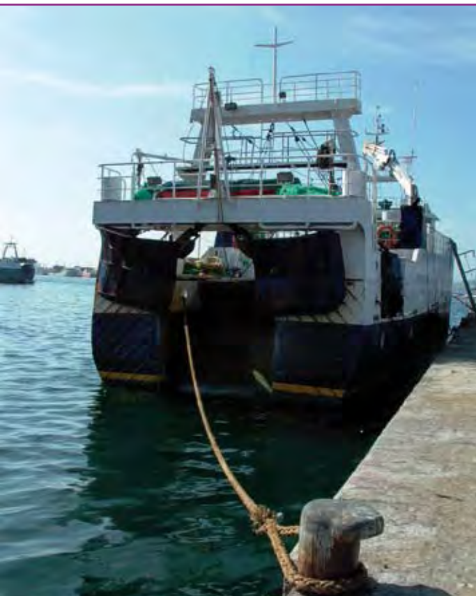
La flota arrastrera de Vigo tiene una gran dependencia de NAFO.

El caso del TAC de fletán en la última reunión de NAFO