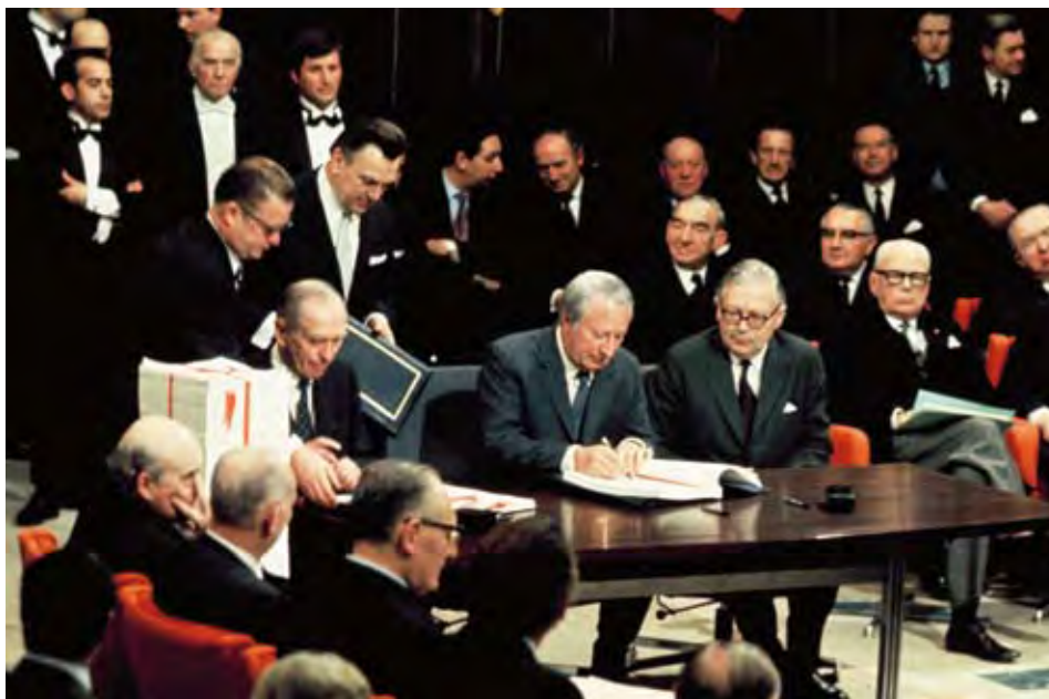
Firma del Tratado de Adhesión del Reino Unido, el 22 de enero de 1972. El mismo día y en el mismo lugar se firmaron también las adhesiones de Dinamarca e Irlanda.

Esa Estabilidad Relativa que ahora se nos presenta inestable únicamente puede ser entendida si se analizan cuatro hechos históricos. Los dos primeros se produjeron con una década de diferencia: la entrada en la Comunidad Económica Europea del Reino Unido, Irlanda y Dinamarca, firmada en 1972, y la aprobación de la Convención sobre el Derecho del Mar de 1982, que estableció una Zona Económica Exclusiva de 200 millas para los Estados costeros. Cuando británicos y daneses negociaban su entrada en la UE ya se vislumbraba en el horizonte que las demandas de soberanía sobre la plataforma continental iniciadas por Chile y Perú, y continuada por otros Estados americanos y africanos, se consolidarían en un derecho para todos los Estados costeros del mundo. El dilema era que, según el principio de igualdad de acceso, la entrada en la CEE implicaría una renuncia a esa