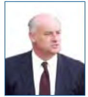
JOE BORG Comisario de Asuntos Marítimos de la Comisión Europea

Extracto del discurso ante la Comisión de Pesca del Parlamento Europeo