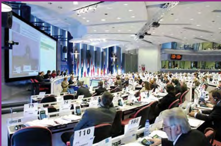
Reunión del Pleno del Comité Económico y Social Europeo.