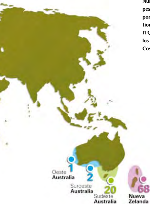
Número de pesquerías por áreas gestionadas por ITQ, según los datos de Costello.