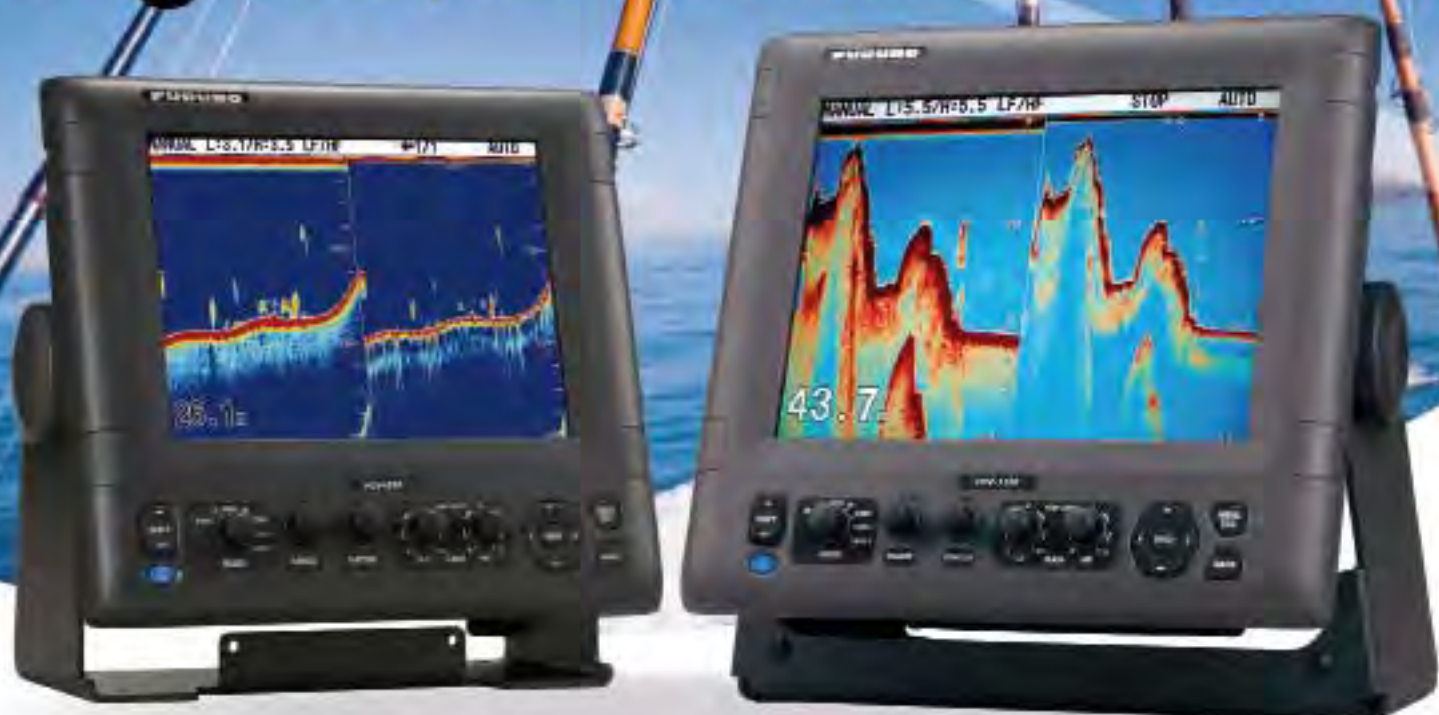
FCV 295 SONDA LCD COLOR 10.4"